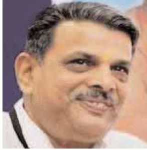
भाषा । मथुरा

राष्ट्रीय स्वयंसेवक संघ (आरएसएस) के सरकारीवाह दत्तात्रेय होसबाले ने शनिवार को कहा कि यह सही ही है कि यदि हम (हिन्दू समाज) जाति, भाषा या प्रांत के भेद से बटेंगे, तो निश्चित रूप से कटेंगे, इसीलिए हिन्दू समाज में एकता आवश्यक है। वह यहां दोनदयाल उपाध्याय गौ विज्ञान अनुसंधान एवं प्रशिक्षण केंद्र परिसर में आयोजित संघ के अखिल भारतीय कार्यकारी मण्डल की द्विदिवसीय बैठक के समापन पर संवाददाता सम्मेलन को संबोधित कर रहे थे। उत्तर प्रदेश के मुख्यमंत्री योगी आदित्यनाथ द्वारा हाल में दिए गए बयान बटेंगे तो कटेंगे के संदर्भ में होसबाले ने कहा, हिंदू समाज एकता से नहीं रहेगा तो आजकल की भाषा में बटेंगे तो कटेंगे हो सकता है। होसबाले ने कहा, यह सही है कि यदि हम (हिन्दू समाज) जाति, भाषा या प्रांत के भेद से बटेंगे, तो निश्चित रूप से कटेंगे, इसीलिए हिन्दू समाज में एकता आवश्यक है। उन्होंने कहा, हिन्दू एकता लोक कल्याण के लिए है। अपने को बचाए रखने और दूसरों का भी मंगल करने के लिए हिन्दू एकता आवश्यक है,