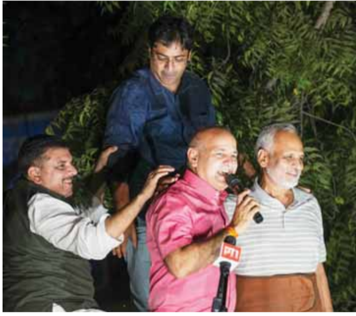
नई दिल्ली में जेल से रिहा होने के बाद आप नेता सत्येंद्र जैन, साथ में मनीष सिंसोदिया तथा संजय सिंह व अन्य।

पार्टी के संयोजक अरविंद केजरीवाल, मनीष सिंसोदिया और संजय सिंह को पिछले कुछ महीनों में जमानत मिली है और उम्मीद है कि वे नेता आप सरकार को बनाए रखने के लिए अगले साल की शुरुआत में दिल्ली में होने वाले विधानसभा चुनावों के लिए बड़े पैमाने पर प्रचार करेंगे। शराब घोटासे से पार्टी के भीतर पैदा हुई उथल-पुथल ने केजरीवाल को मुख्यमंत्री की कमान आतिशी को सौंपने के लिए मजबूर कर दिया। जेल जाने के समय जैन और सिंसोदिया मंत्री थे। यह ऐसे समय में हुआ है जब पूरा आप नेतृत्व दो राज्यों-हरियाणा और जम्मू-कश्मीर में भारी हार के बाद महाराष्ट्र और झारखंड में विधानसभा चुनावों से पहले अपनी राजनीतिक के बारे में जनता की धारणा को फिर से हासिल करने की कोशिश कर रहा है। मई में लोकसभा चुनावों और हरियाणा में विधानसभा चुनावों में हार के बाद, आप