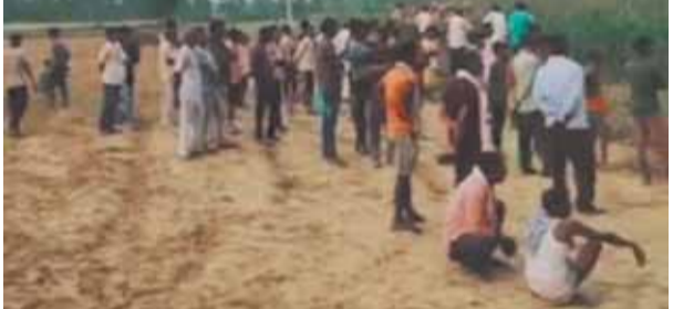
मौके पर मौजूद गांभीण एवं पुलिसकर्मी