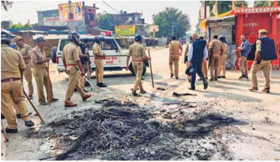
उत्तर प्रदेश के बहराइच में सांप्रदायिक झड़प में एक व्यक्ति की मौत के बाद हिंसा प्रभावित इलाके में तैनात सुरक्षाकर्मी।