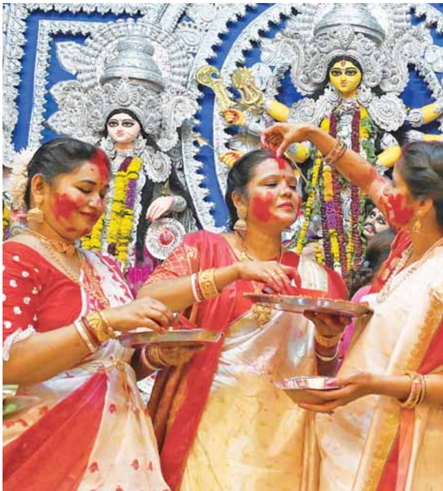
राजधानी नई दिल्ली में रविवार को दुर्गा पूजा उत्सव के समापन के अवसर पर पूजा पंडाल में 'सिंदूर खेला' में एक-दूसरे को सिंदूर लगाती महिलाएं।