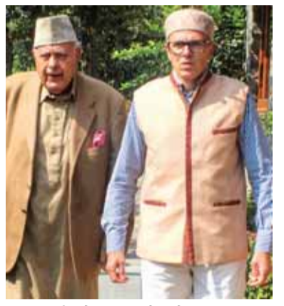
जम्मू-कश्मीर नेशनल कॉन्फ्रेंस के अध्यक्ष फारूक अब्दुल्ला अपने बेटे और पार्टी उपाध्यक्ष उमर अब्दुल्ला के साथ जम्मू-कश्मीर विधानसभा चुनाव में जीत के बाद श्रीनगर स्थित अपने आवास पर पार्टी आई