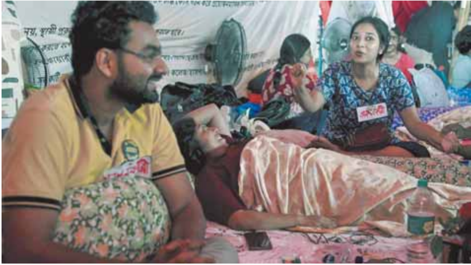
कोलकाता में चिकित्सक से बलात्कार और हत्या मामले में अपनी मांगों को लेकर धरने पर बैठे चिकित्सक