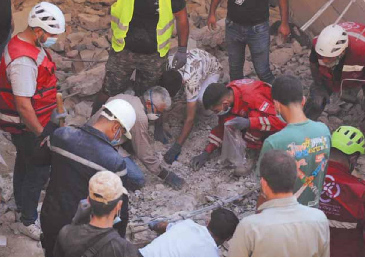
इमरान की बगवारी के बाद लेबनान में चलाया जा रहा राहत अभियान।

कोलंबा (भाषा)। कोलंबो के निकट एक उपनगरीय इलाके में 20 से अधिक चीनी नागरिकों को साइबर अपराध में शामिल होने के संदेह में गिरफ्तार किया गया। पुलिस को बताया कि ए सभी बिना वीजा के रह रहे थे। पुलिस के इन सभी नागरिकों की उम्र 22 से 49 वर्ष के बीच है। इन लोगों को कोलंबो के दक्षिण में स्थित पनादुर उपनगर के गोरकाना इलाके में स्थित एक होटल से गिरफ्तार किया गया। स्थानीय मीडिया ने पुलिस के हवाले से बताया कि युवा सूचना कार्याई करते हुए पुलिस ने होटल पर छापा मारा और पांच लैपटॉप, दो आईफोन सहित 437 मोबाइल फोन, 17 राउटर और अन्य सामान जब्त किए। पुलिस के मुताबिक, ए सभी सामग्री संभावित वित्तीय धोखाधड़ी से जुड़ी होने का संदेह है। पुलिस ने बताया कि मामले की जांच जारी रहेगी ताकि यह पता लगाया जा सके कि कहीं यह चीनी समूह श्रीलंका में साइबर ऑनलाइन घोटालों को अंजाम देने वाले अन्य चीनी समूह से जुड़ा हुआ तो नहीं है, जिसके सदस्यों को हनवला क्षेत्र से गिरफ्तार किया गया था।