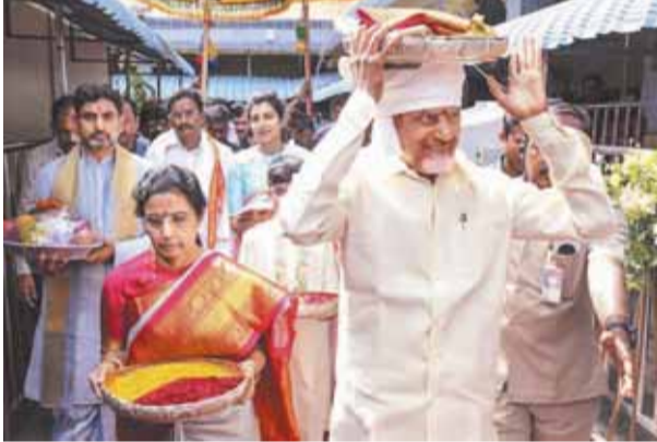
विजयबाड़ा में इंद्रकीलाम्री मंदिर में पूजा के लिए जाते आंध्र प्रदेश के मुख्यमंत्री चंद्रबाबू नायडू

अमरावती ( भाषा ) । आंध्र प्रदेश के मुख्यमंत्री एन. चंद्रबाबू नायडू ने बुधवार को कहा कि हरियाणा और जम्मू कश्मीर के विधानसभा चुनाव के रूख को देखा जाए तो महाराष्ट्र और झारखंड में परिणाम भी इसी तरह के होंगे जहां इस साल के आखिर तक विधानसभा चुनाव होने की संभावना है। दिल्ली के दो दिवसीय दौर से लौटने के बाद एक संवाददाता सम्मेलन को संबोधित करते हुए नायडू ने प्रधानमंत्री नरेन्द्र मोदी की प्रशंसा की और कहा कि देश को एक राष्ट्र एक चुनाव का समर्थन करने की जरूरत है क्योंकि बार-बार चुनाव होने से विकास कार्य बाधित होंगे। उन्होंने कहा, जम्मू कश्मीर में राष्ट्रीय जनतांत्रिक गठबंधन (राजग) सरकार द्वारा लिए गए निर्णयों के कारण न केवल सामान्य स्थिति बहाल हुई है, बल्कि भाजपा (चुनाव में मत प्रतिशत के मामले में) अकेली सबसे बड़ी पार्टी बनकर उभरी है। यह अच्छी बात है। उन्होंने कहा, नरेन्द्र मोदी ने विकास, कल्याण और