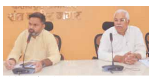
प्राइवेट बैंकों के साथ बैठक करते जिलाधिकारी।

● सूर्यास्त के बाद वसूली की जानकारी मिलने पर होगी कार्यवाही