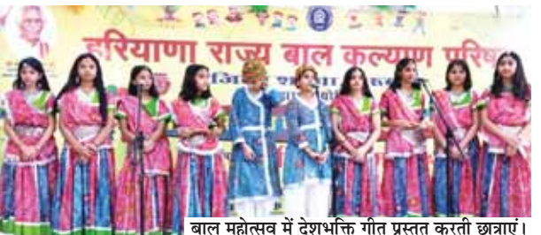
बाल महोत्सव में देशभक्ति गीत प्रस्तुत करती छात्राएं।

जिला परिषद स्वतंत्रता सेनानी सभागार में आज भी जिला स्तरीय बाल महोत्सव की धूम रही। बच्चों ने रंगारंग कार्यक्रम प्रस्तुत कर श्रोताओं का दिल जीत लिया।