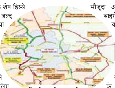
दिल्ली-एनसीआर का मैप

मौजूदा आंतरिक और बाहरी रिंग रोड पर यातायात को सुगम बनाने के अलावा, यूईआर-2 की परिक्ल्पना डीडीए ने दिल्ली के लिए दिल्ली-एनसीआर का मैप पट्टे प्रदान करने के अलावा बाहरी, पश्चिम और दक्षिण-पश्चिम दिल्ली में आवागमन में सुधार करेगा। यह परियोजना, राष्ट्रीय राजधानी में बवना, नरेला-कंडावाला, मुंडका और द्वारका आदि के बीच पूरे खंड के माध्यम से एनएच-44