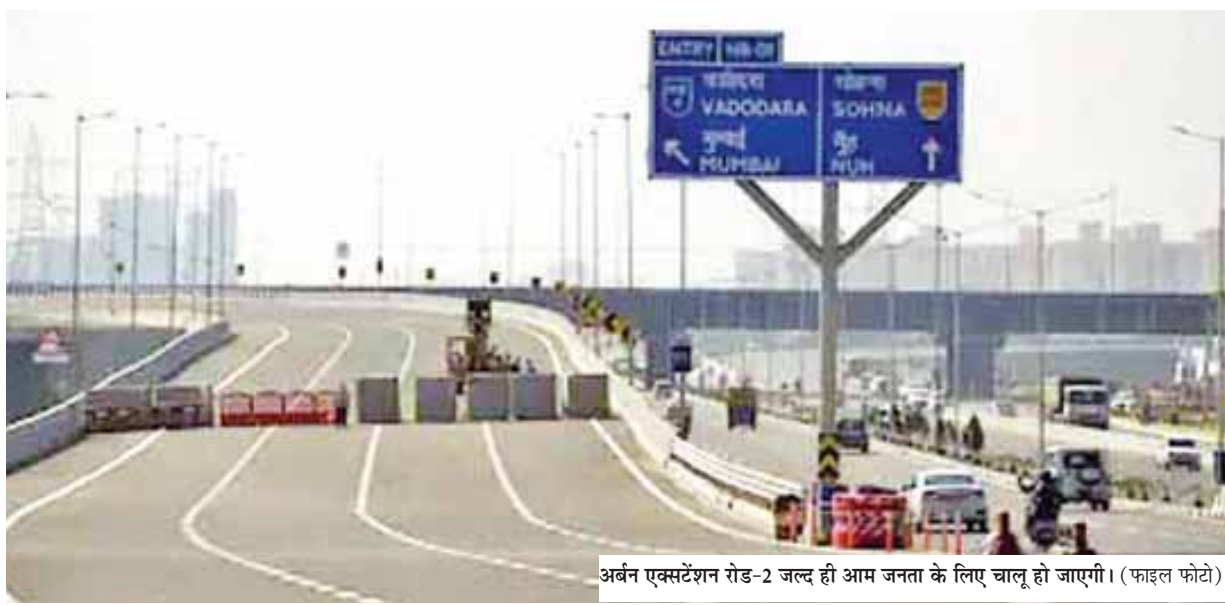
अर्बन एक्सटेंशन रोड-2 जल्द ही आम जनता के लिए चालू हो जाएगी। (फाइल फोटो)

उपराज्यपाल कार्यालय के अनुसार, राष्ट्रीय राजमार्ग प्राधिकरण द्वारा उपलब्ध कराए गए 3600 करोड़ रुपये की लागत से निर्मित दिल्ली विकास प्राधिकरण की महत्वाकांक्षी