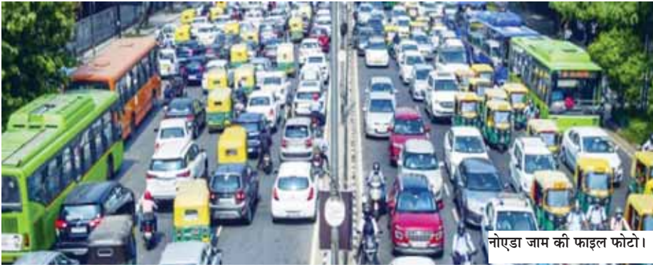
नोएडा जाम की फाइल फोटो।