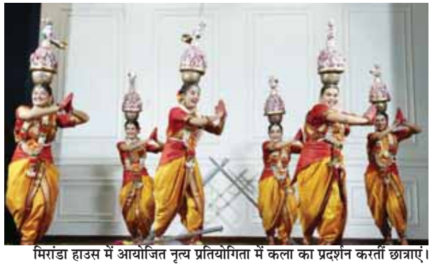
मिरांडा हाउस में आयोजित नृत्य प्रतियोगिता में कला का प्रदर्शन करती छात्राएं।