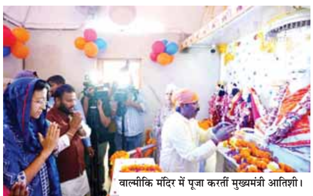
वाल्मीकि मंदिर में पूजा करती मुख्यमंत्री आतिशी।

वाल्मीकि जयंती के मौके पर मुख्यमंत्री आतिशी ने गुरुवार सुबह पंचकुड़वा रोड स्थित वाल्मीकि मंदिर में जाकर भगवान वाल्मीकि के दर्शन किए और आशीर्वाद लिया। सीएम ने मंदिर पहुंचकर सर्वप्रथम माथा टेका, भगवान वाल्मीकि की पुष्पमाला अर्पित की और उसके बाद मंदिर की प्रदक्षिणा की और दिल्ली के लोगों को बेहतर के लिए आशीर्वाद मांगा। आतिशी ने एक्स कहा कि भगवान वाल्मीकि वो भगवान हैं, जिनके हाथ में कलम है। भगवान हैं