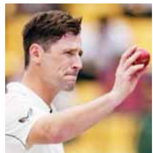
बैंगलुरु में पांच विकेट लेने के बाद गेंद दिखाते न्यूजीलैंड के टॉप हेनरी

क्योंकि पहले दिन का खेल बारिश के कारण धुल गया था, जिससे बैंगलुरु के चिन्नास्वामी स्टेडियम में दूसरे दिन उनकी बल्लेबाजी की ताकत पर असर पड़ा। भारत का 46 रन का स्कोर अब घरेलू मैदान पर सबसे कम स्कोर बन गया है, इससे पहले वेस्टइंडीज के खिलाफ दिल्ली में 75 रन पर आँट आउट होने के बाद (1987)। आईसीसी विश्व टेस्ट चैंपियनशिप (2023-2025) में भारत की जीत