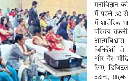
लेजर वैली पार्क में आयोजित सरस आजीविका मेला 2024 में लनिंग पेवेलियन में एक सत्र में मौजूद लखपति दीवियां।