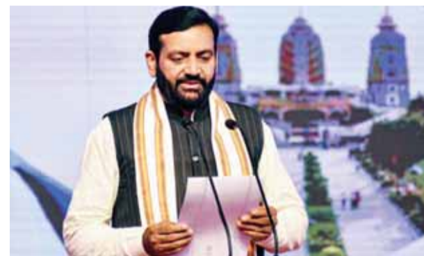
पंचकुला में दूसरी बार हरियाणा के मुख्यमंत्री पद की शपथ ग्रहण करते नायब सिंह हैली

● मोदी व शाह की उपस्थिति में ली शपथ, 11 कैबिनेट व दो राज्य मंत्री बनाए गए