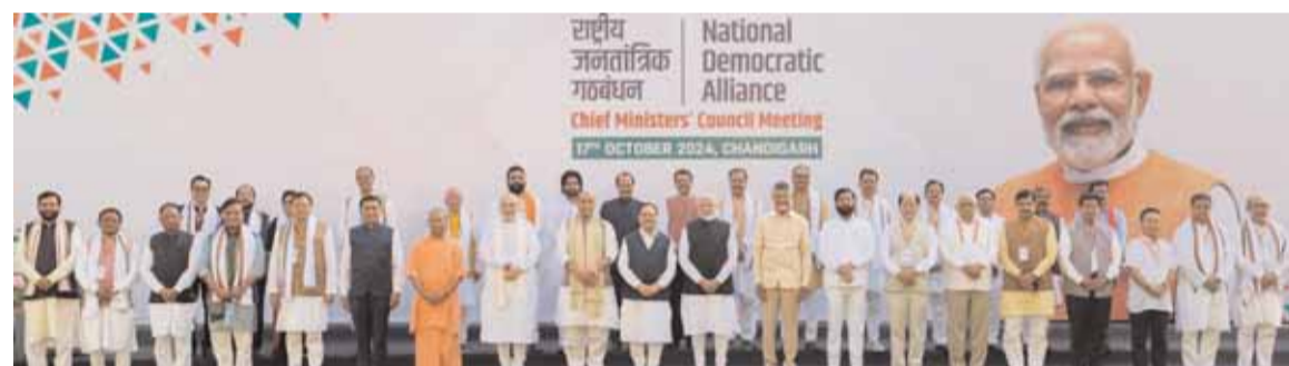
चंडीगढ़ में राष्ट्रीय जनतांत्रिक गठबंधन के मुख्यमंत्रियों की परिषद की बैठक में हरियाणा के मुख्यमंत्री नायब सैनी तथा अन्य राज्यों के मुख्यमंत्री

भाजपा और उसके सहयोगी दलों महाराष्ट्र, आंध्र प्रदेश, बिहार, सिक्किम, नागालैंड और उत्तराखण्ड विधानसभा चुनावों से पहले और हरियाणा में ऐतिहासिक जीत और जम्मू-कश्मीर में नई सरकार के गठन के तुरंत बाद हुई है। एनडीए के 20 मुख्यमंत्री और उनके