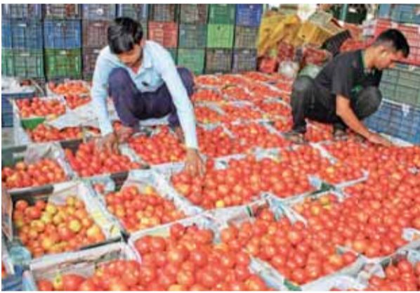
सामान्य होने में कम से कम पांच से छह सप्ताह या उससे अधिक समय लगेगा।

व्यापारियों ने इसका कारण कर्नाटक और महाराष्ट्र से आपूर्ति में कमी को बताया है, क्योंकि दूसरी फसल की खेती समाप्त हो गई है। आजदपुर मंडी, गाजीपुर मंडी और ओखला सब्जी मंडी समेत दिल्ली की प्रमुख थोक सब्जी मंडियों में भी टमाटर के दाम बढ़ गए हैं। आजदपुर मंडी के टमाटर व्यापारियों के मुताबिक, इस समय रोजाना 50 से 60 ट्रक के मुकाबले 30 से 35 ट्रकों की आवक है। थोक बाजार में टमाटर 70-80 रुपये प्रति किलोग्राम बिक रहा है और व्यापारियों को उम्मीद है कि आने वाले दिनों में कुछ पंजाब कॉलोनियों में टमाटर के दाम 125 से 150 रुपये प्रति किलोग्राम तक पहुंच सकते हैं। प्याज का थोक भाव 45 रुपये प्रति किलोग्राम और आलू का 30 रुपये प्रति किलोग्राम है। आपूर्ति