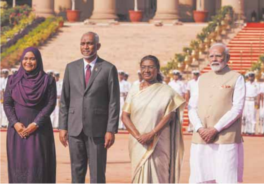
नई दिल्ली में राष्ट्रपति मुर्मु और प्रधानमंत्री नरेन्द्र मोदी के साथ मालदीव के राष्ट्रपति मोहम्मद मुइज्जु तथा उनकी पत्नी साजिदा

की पड़ोस नीति और सागर (क्षेत्र में सभी के लिए सुरक्षा और वृद्धि) दृष्टिकोण में महत्वपूर्ण स्थान है। मोदी ने कहा, भारत ने हमेशा एक पड़ोसी देश की जिम्मेदारियों को निभाया है। आज, हमने अपने आपसी सहयोग को रणनीतिक दिशा देने के लिए एक व्यापक आर्थिक और समुद्री सुरक्षा साझेदारी का दृष्टिकोण अपनाया है। इसके पहले, राष्ट्रपति द्रौपदी मुर्मू ने मुइज्जू का राष्ट्रपति भवन में औपचारिक स्वागत किया। इस मौके पर प्रधानमंत्री मोदी भी मौजूद थे।