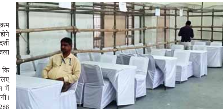
सेक्टर-2 स्थित श्रीमती सुषमा स्वराज राजकीय महाविद्यालय के हाल में 14 टेबल पर 19 राउंड में मतगणना, 89- फरीदाबाद विस क्षेत्र के 249 बूथों के लिए फरीदाबाद सेक्टर-14 स्थित डीएचओ पब्लिक स्कूल के महात्मा हंसराज ऑडिटोरियम के हाल में 14 टेबल पर 18 राउंड में मतगणना और 90-

जिला निर्वाचन अधिकारी ने बताया कि 85-पृथला विस क्षेत्र के 229 बूथ के लिए सेक्टर-16 स्थित पंजाबी भवन के हाल में 14 टेबल पर 16 राउंड में मतगणना होगी। इसी तरह 86-एनआईटी विस क्षेत्र के 288 बूथ के लिए एनआईटी-2 लखानी धर्मशाला के हाल में 14 टेबल पर 21 राउंड में मतगणना, 87- बड़खल विस क्षेत्र के 283 बूथ के लिए एनआईटी-01 स्थित खान दौलतराम धर्मशाला के हाल में 14 टेबल पर 21 राउंड में मतगणना, 88-बल्लभगढ़ विस क्षेत्र के 256 बूथ के लिए बल्लभगढ़