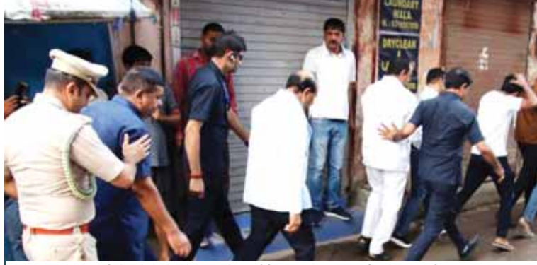
कॉलोनी की बदहाल का जायजा लेते उपराज्यपाल विनये कुमार सक्सेना।

राजधानी में पीने के पानी के लिए महिलाओं को हाथों में पाइप लिए खड़े देखना दुखद