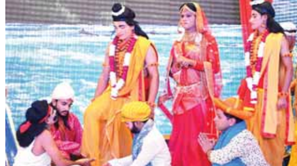
गुरुग्राम स्थित श्री दुर्गा रामलीला में मंचन करते कलाकार।

जैकपुर स्थित श्री दुर्गा रामलीला के छठे दिन की लीला में पुत्र वियोग में राजा दशरथ ने प्राण त्यागने से लेकर भरत के ननिहाल में पहुंचने की लीला का मंचन किया गया। कलाकारों ने रामलीला में जीवंत अभिनय किया। लीला में दिखाया गया कि राम-लक्ष्मण और सीता वनों में जा रहे हैं। इस दौरान उनकी निषादराज से भेंट होती है। तीनों को वनों में छोड़कर सुमंत अयोध्या महल में लौटते हैं। केवट ने राम, लक्ष्मण और सीता को नदी पार करवाई। इससे पहले उन्होंने तीनों के चरण धोकर उस पानी को