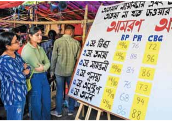
कोलकाता में आरजी कर मेडिकल कॉलेज और अस्पताल में बलात्कार और हत्या की घटना के खिलाफ प्रदर्शन कर रहे कुछ जूनियर डॉक्टरों के स्वास्थ्य मानकों को दर्शाता एक आंकड़ा।