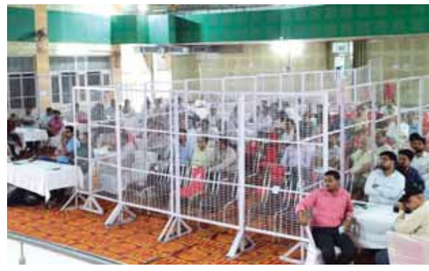
मतगणना को लेकर की गई तैयारियों के दौरान मौजूद गणनाकर्मी।

उपरोक्त ने बताया कि किसी भी शराब की दुकान, होटल, रेस्तरां, क्लब और स्टाइल होटल आदि और शराब रखने और आपूर्ति के लिए लाइसेंस की विभिन्न श्रेणियों के तहत काम करने वालों को भी उक्त अवधि में शराब परोसने की अनुमति नहीं दी जाएगी।