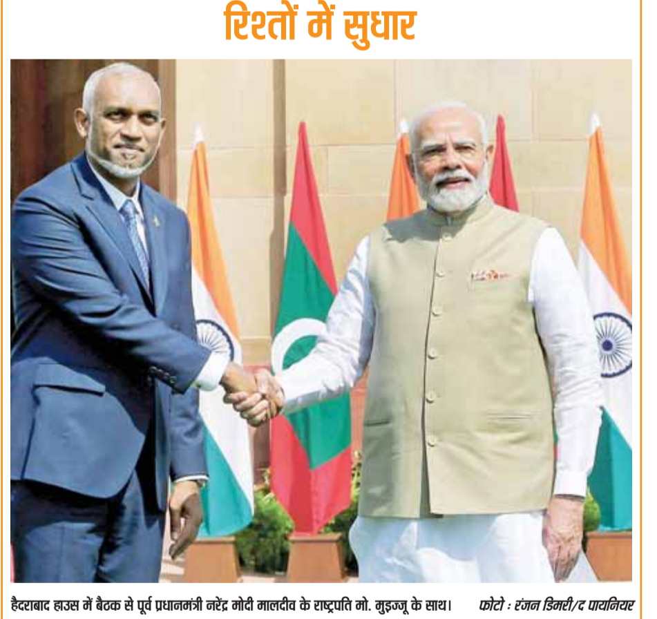
हैदराबाद हाउस में बैठक से पूर्व प्रधानमंत्री नरेंद्र मोदी नालदीव के राष्ट्रपति मो. नुजुम्नू के साथ।

के भव्य उद्घाटन के बाद यह पहला उत्सव भारत की समृद्ध सांस्कृतिक विरासत को उजागर करेगा। भारत की पारंपरिक शिल्पकला का सम्मान करने के लिए स्थानीय कारीगरों द्वारा तैयार किए गए दो लाख दीयों से मंदिर को रोशन किया जाएगा। ट्रस्ट ने मंदिर की सुंदरता को बनाए रखने के लिए दीयों की व्यवस्था की सावधानीपूर्वक योजना बनाई है। इस वर्ष के उत्सव की एक खास विशेषता राम लला और उनके भाइयों के लिए प्रसिद्ध भारतीय फैशन डिजाइनर मनीष मल्होत्रा द्वारा तैयार किए गए विशेष रूप से डिजाइन किए गए परिधान हैं। अपनी जटिल शिल्पकला, परंपरा और आधुनिकता के मिश्रण के लिए जाने वाले मल्होत्रा के डिजाइन देवता के श्रृंगार में एक विशेष आकर्षण जोड़ेंगे। ट्रस्ट के एक सदस्य ने कहा, मनीष मल्होत्रा उत्सव की मेक इन इंडिया बढ़ावा देने के साथ देवताओं के लिए ये विशेष परिधान तैयार कर रहे हैं। उत्सव में पूरे दिन विशेष प्रसाद और (शेष पृष्ठ 9)