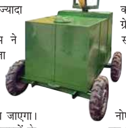
खरीदने के लिए 3.88 करोड़ रूपए खर्च किए

जा रहे हैं। इसमें से 5 एंटी स्मॉग गन को खरीदा जा चुका है। जबकि 10 नए एंटी स्मॉग गन को खरीदा जा रहा है। 7.39 करोड़ में सड़क और पोंधों पर पानी का छिड़काव करने के लिए 25 रिमॉक वाटर टैंकर खरीदे जा रहे हैं। इसमें 5 आ चुके हैं जिनका प्रयोग किया जा रहा है। बाकी इसी महीने में खरीद लिए जाएंगे। सड़कों की साफ-सफाई के लिए छह मैकेनिकल स्वीपिंग में 4 खरीदी जा चुकी है। 2 खरीदने की प्रक्रिया में है। इसके अलावा 10.21