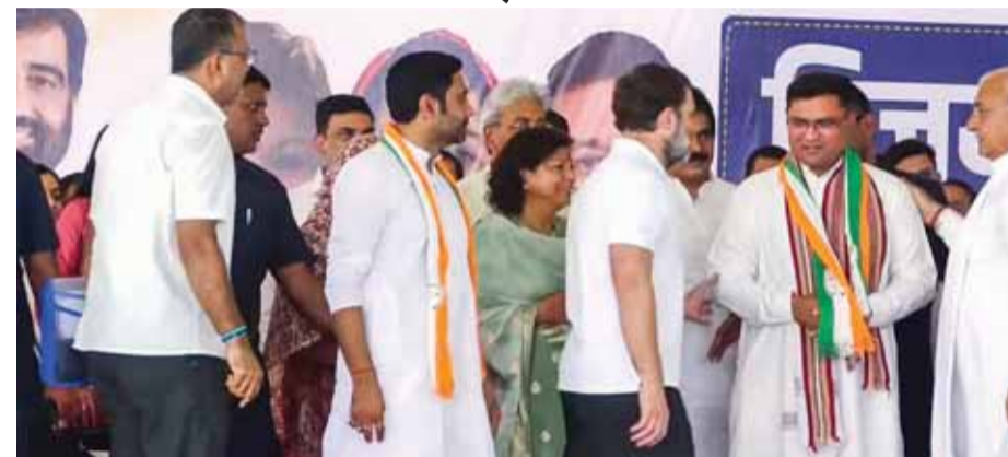
हरियाणा के महेंद्रगढ़ जिले में भाजपा से कांग्रेस में शामिल होने वाले अशोक तंवर के साथ लोकसभा में नेता प्रतिपक्ष राहुल गांधी।

हरियाणा में पांच अक्टूबर को होने वाले विधानसभा चुनाव के लिए जोरदार प्रचार अभियान बृहस्पतिवार शाम को समाप्त हो गया। सत्तारूढ़ भाजपा को बड़ा झटका तब लगा जब उसके वरिष्ठ नेता और पूर्व सांसद अशोक तंवर, जो कुछ महीने पहले लोकसभा चुनाव में सिरसा से पार्टी के उम्मीदवार थे, बृहस्पतिवार को हरियाणा के महेंद्रगढ़ जिले में राहुल गांधी की रैली में फिर से कांग्रेस में शामिल हो गए।