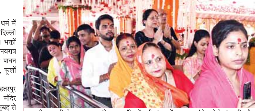
शारदीय नवरात्रि के अवसर पर झंडेवाला मंदिर में बड़ी संख्या में श्रद्धालु पहुंचे।

नवरात्रि के पहले दिन, भक्तों ने छतरपुर मंदिर, झंडेवाला मंदिर, कालकाजी मंदिर समेत अन्य मंदिरों में पूजा-अर्चना की। सुबह से ही मंदिरों में भक्तों की भीड़ लगी गई थी। नवरात्रि के दौरान यहां सुबह-शाम भक्तों की लंबी-भीड़ लगी रहती है। शाहजहां के शासनकाल के दौरान यहां झंडे चढ़ाए जाते थे, जिसके कारण इस मंदिर का नाम झंडेवाला मंदिर दिया गया। कालकाजी मंदिर महाकाली को समर्पित इस मंदिर के प्रति लोगों का अटूट विश्वास है। इसे दिल्ली के सबसे प्राचीन मंदिरों