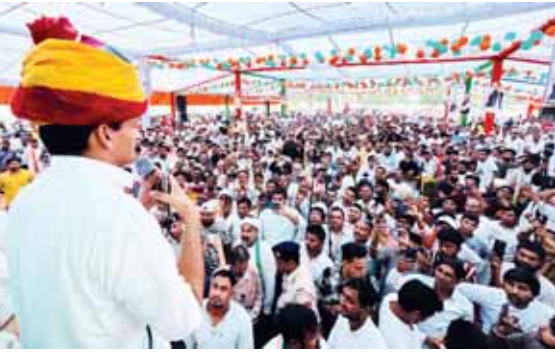
पटौदी में चुनावी रैली को संबोधित करते सांसद दीपेंद्र हड़्डा।

कांग्रेस प्रत्याशियों के लिये धुंआधार प्रचार करते हुए दीपेंद्र हड़्डा ने हिमाचल बार्डर से लेकर राजस्थान बार्डर तक की चुनावी रैलियां की और 8 विधानसभा क्षेत्रों में एक के बाद एक रैली कर कांग्रेस प्रत्याशियों के पक्ष में वोट मांगे। इस दौरान दीपेंद्र हड़्डा का जादू हर जगह बढ़ चढ़ कर दिखाई जा रहा है। रैलियों में जब वो पूछते हैं कि क्या रिपट है तो जनता एक साथ बोल पड़ती है कांग्रेस सरकार आ रही है। उन्होंने कांग्रेस प्रत्याशियों को बड़े बहुमत से जिताने की अपील करते हुए कहा कि 8 अक्टूबर के बाद प्रदेश में कांग्रेस सरकार आ रही है और बीजेपी जा