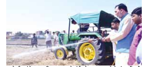
बायो डी-कंपोजर का छिड़काव करते मंत्री गोपाल राय।