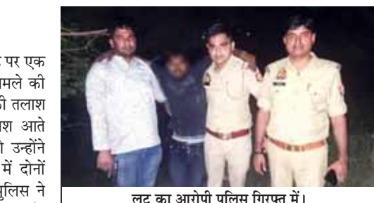
लूट का आरोपी पुलिस गिरफ्त में।

बच्ची के परिवार का आरोप है कि 26 तारीख को स्कूल वैन में बच्ची के साथ वैन ड्राइवर ने बेड टच किया था। परिवार के मुताबिक इस मामले में स्कूल के ट्रांसपोर्टर समेत अन्य लोग भी दोषी हैं और उनके खिलाफ कार्रवाई होनी चाहिए। गाजियाबाद के थाना कविनगर क्षेत्र में रहने वाली पीड़ित बच्ची के पिता के मुताबिक 26 सितंबर को जब उनकी 5 साल की बटी स्कूल वैन से उनकी आई तो उसने घर में बताया कि वैन ड्राइवर ने उसको बेड टच किया था। इस मामले को लेकर थाना कविनगर में मुकदमा दर्ज कराया गया था।