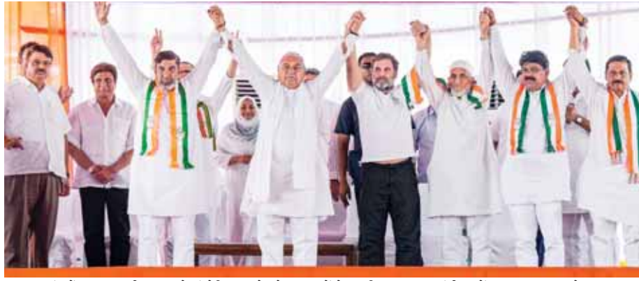
नूं में एक चुनावी सभा को संबोधित करते लोकसभा में नेता प्रतिपक्ष राहुल गांधी, पूर्वप्रद हड़्डा व अन्य नेता।