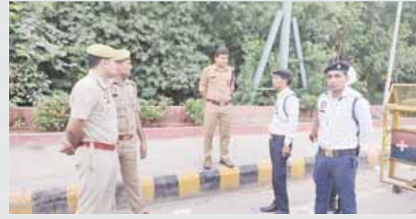
चिल्ला बांडर पर यातायात व्यवस्था का निरीक्षण करते एसीपी व अन्य।