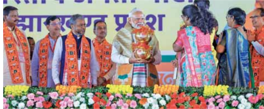
हजारीबाग में प्रधानमंत्री नरेंद्र मोदी पार्टी की परिवर्तन महासभा के दौरान झारखंड भाजपा अध्यक्ष बाबूलाल मराड़ी व अन्य के साथ

पश्चिम एशिया में तनाव बढ़ने पर पहली बार प्रतिक्रिया देते हुए भारत ने बुधवार को सभी पक्षों से संयम बरतने का आह्वान किया और कहा कि ऐसा न हो कि यह संघर्ष पूरे क्षेत्र को अपनी चपेट में ले ले। यह टिप्पणी तब की है जब एक दिन पहले ईरान ने इजराइल द्वारा हिजबुल्ला प्रमुख हसन नसरल्ला तथा आतंकवादी समूह के अन्य कमांडरों की हत्या के जवाब में यहूदी देश पर करीब 200 मिसाइलें दागीं। नई दिल्ली ने कहा कि वह पश्चिम एशिया में तनाव बढ़ने को लेकर बहुत चिंतित है और उसने सभी मुद्दों को संवाद तथा कूटनीति के जरिए हल करने का आह्वान किया। विदेश मंत्रालय ने कहा, हम पश्चिम एशिया में तनाव बढ़ने को लेकर बहुत चिंतित हैं और सभी संबंधित पक्षों से संयम बरतने तथा नागरिकों की रक्षा (शेष पृष्ठ 9)