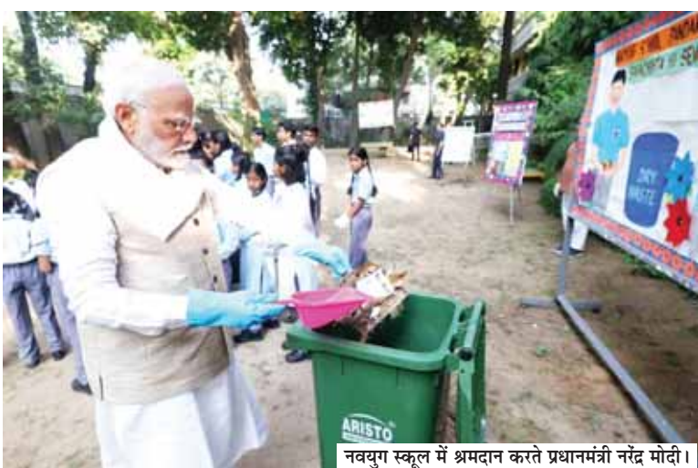
नवयुग स्कूल में श्रमदान करते प्रधानमंत्री नरेंद्र मोदी।

प्रधानमंत्री ने छात्रों के साथ बातचीत की और स्वच्छता अभियान में छात्रों के साथ सक्रिय रूप से भाग लिया। उन्होंने छात्रों के साथ स्वच्छता के लाभ और योग आसन के बारे में बातचीत की। इस अवसर पर छात्रों ने स्वच्छता गीत गाया, जिसकी प्रधानमंत्री ने सराहना की। स्वच्छता अभियान में इसके अलावा