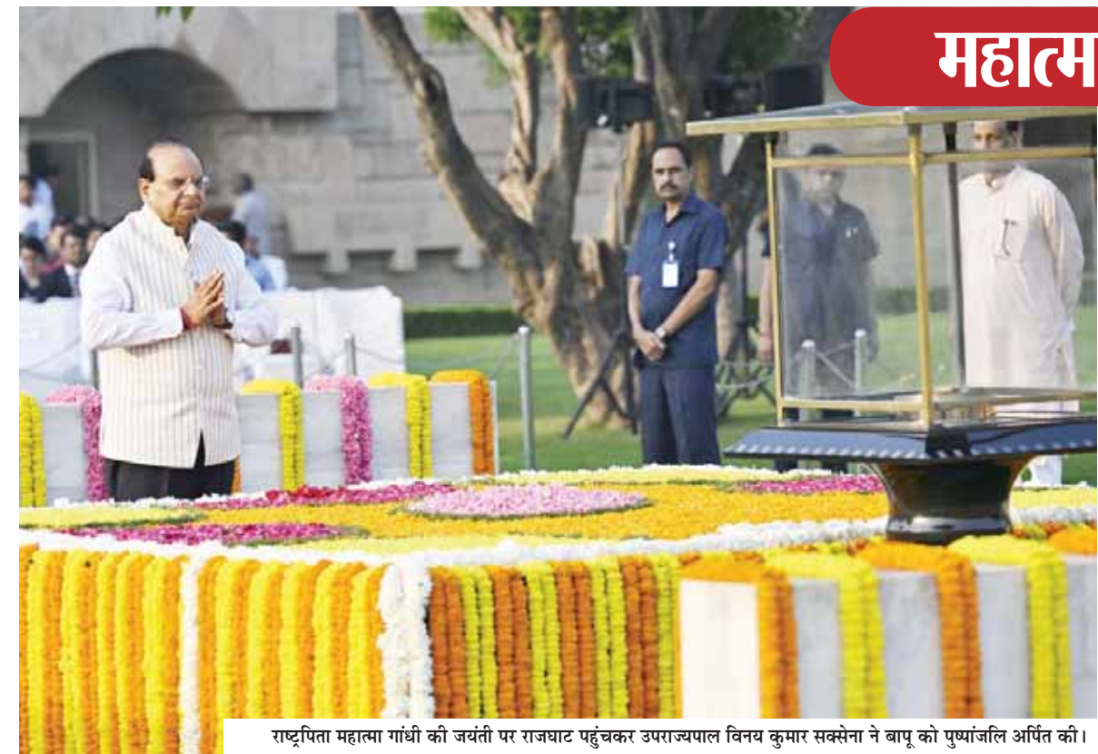
राष्ट्रपिता महात्मा गांधी की जयंती पर राजघाट पहुंचकर उपराज्यपाल विनय कुमार सक्सेना ने बापू को पुष्पांजलि अर्पित की।