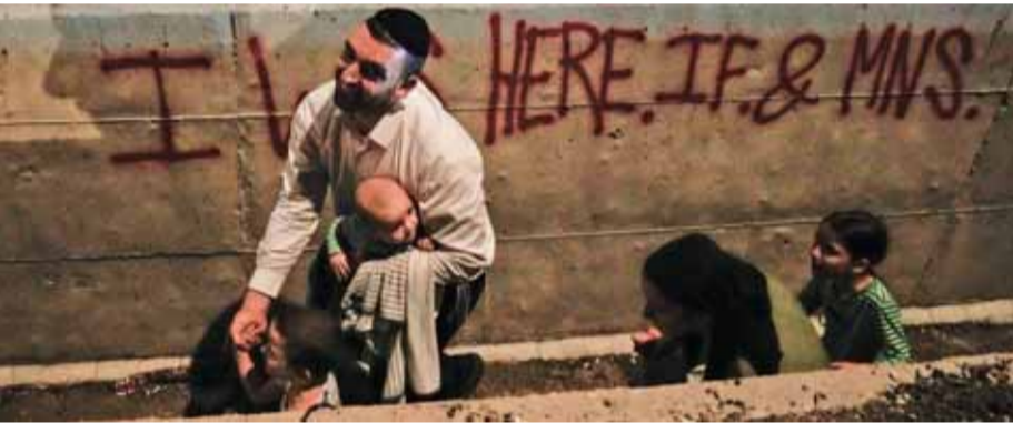
इजराइल के उत्तरांचल और तेल अवीव के बीच शोरेय में ईरान से आने वाली मिसाइलों की चेतावनी के लिए सायरन बजाने पर सुरक्षित स्थान पर सड़क के किनारे छिपते हुए लोग।

एजेंसियाँ। यरूशलेम/देहर अल-बलाह (गाजा पट्टी)