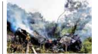
पुणे जिले के बावधन इलाके में बुधवार को दुर्घटनाग्रस्त होने के बाद एक हेलीकॉप्टर का मलबा। इस हादसे में दो लोगों के मारे जाने की आशंका है।

ऐसी ताकतों को बाहर करने का समय आ गया है। मोदी ने भाजपा की परिवर्तन यात्रा के समापन के मौके पर आयोजित एक कार्यक्रम में कहा, झारखंड में बेटी, माटी, रोटी की रक्षा करने और भ्रष्टाचार पर अंकुश लगाने के लिए परिवर्तन का समय आ गया है। झारखंड मुक्ति मोर्चा (झामुमो) के नेतृत्व वाला गठबंधन एक खतरनाक खेल खेल रहा है, जो घुसपैठियों को संरक्षण देते हुए लोगों की पहचान, संस्कृति और परंपराओं को खतरे में डाल रहा है। मोदी ने आरोप लगाया कि झामुमो के नेतृत्व वाले गठबंधन को ऐसे लोग चला रहे हैं जो झारखंड की पहचान, संस्कृति और विरासत को मिटाना चाहते हैं। प्रधानमंत्री ने कहा, झामुमो और कांग्रेस में उनके आका झारखंड में आदिवासी समुदाय को अल्पसंख्यक बनाना चाहते हैं। उन्होंने हमेशा आदिवासी समाज को धोखा दिया है और उन्हें कभी प्रगति करते नहीं देख सकते। (शेष पृष्ठ 9)