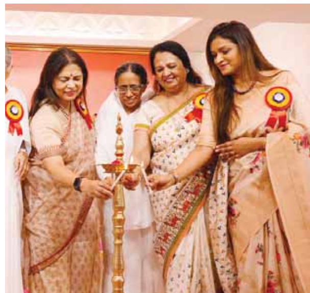
कार्यक्रम में दीप प्रज्वलित करतीं पूर्व सांसद मीनाक्षी लेखी।

भारतीय संस्कृति में शक्ति का विशेष सम्मान होता है। नारी शक्ति का रूप है। भारतीय संस्कृति में महिलाओं को श्रेष्ठ स्थान प्राप्त है। लेकिन सामाजिक असंतुलन के कारण महिलाओं को मुश्किलों का सामना करना पड़ रहा है। असंतुलन का कारण वैचारिक विकृति है। उक्त विचार पूर्व केंद्रीय संस्कृति और विदेश राज्य मंत्री मोनाक्षी लेखी ने धार्मिक संस्था ब्रह्माकुमारीज के ओम शांति रिट्रीट में संस्कृति की संरक्षक महिला विषय पर आयोजित 3 दिवसीय महिला सम्मेलन का शुभारंभ करते हुए व्यक्त किए।