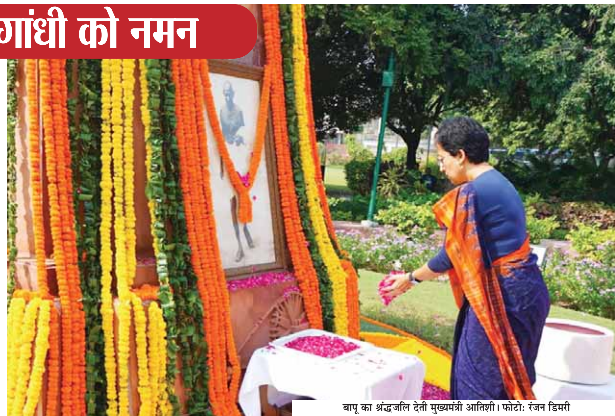
बापू का श्रद्धांजलि देती मुख्यमंत्री आतिशी।