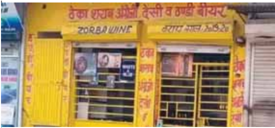
गुरुग्राम