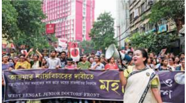
बंगाल जुनियर डॉक्टर्स फ्रंट के सदस्य और अन्य लोग बुधवार को आरजी कर मेडिकल कॉलेज और अस्पताल में एक प्रशिक्षु डॉक्टर के कथित जौल उद्घाटन और हत्या के लिए न्याय की मांग करने के लिए 'माहालत' पर एक नैगा टैली में भाग लेते हैं।