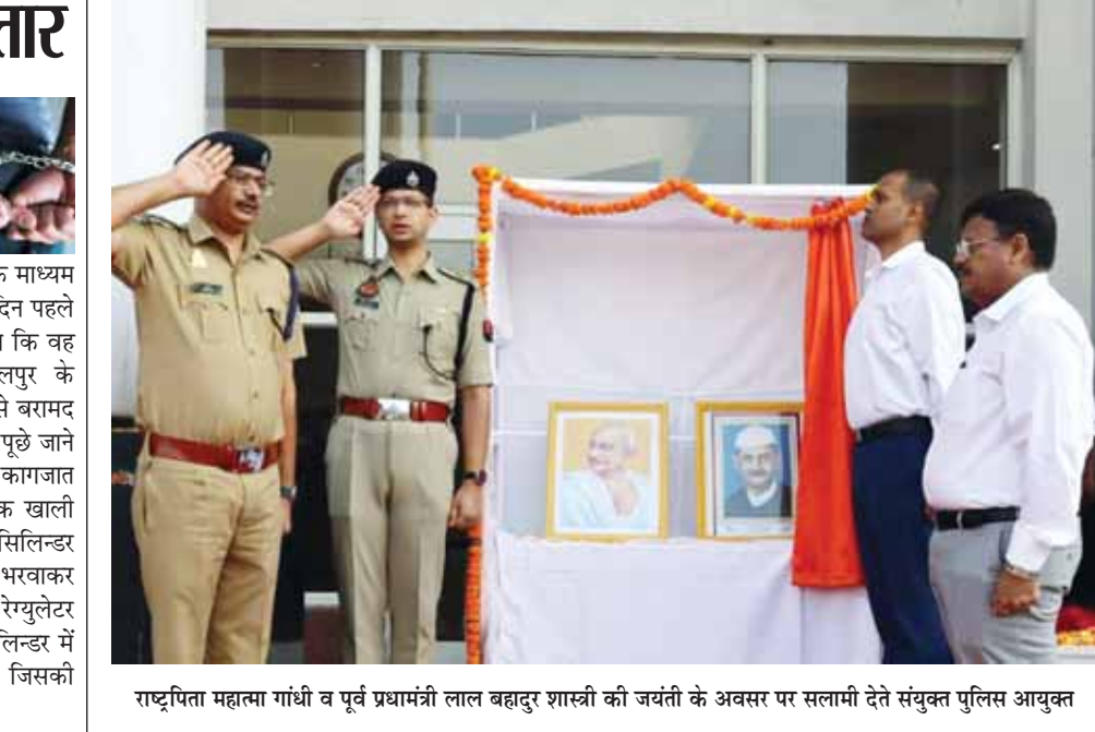
राष्ट्रपिता महात्मा गांधी व पूर्व प्रधानमंत्री लाल बहादुर शास्त्री की जयंती के अवसर पर सलामी देते संयुक्त पुलिस आयुक्त