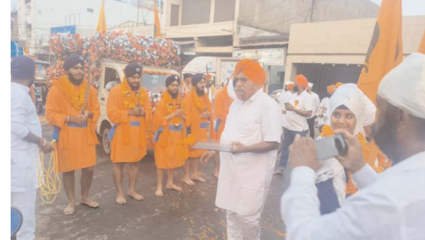
पायनियर संवाददाता भाटापारा www.dailypioneer.com

सिख पंथ के संस्थापक गुरु नानक देव जी के जन्म दिवस पर भाटापारा सिख समाज के द्वारा निकाली गई शोभायात्रा का भारतीय जनता पार्टी के कार्यकर्ताओं ने फव्वारा चौक पर पंज प्यारो, पालकी साहब में विराजमान गुरु ग्रंथ साहब के चित्र पर माथा टेककर आशीर्वाद लिया।