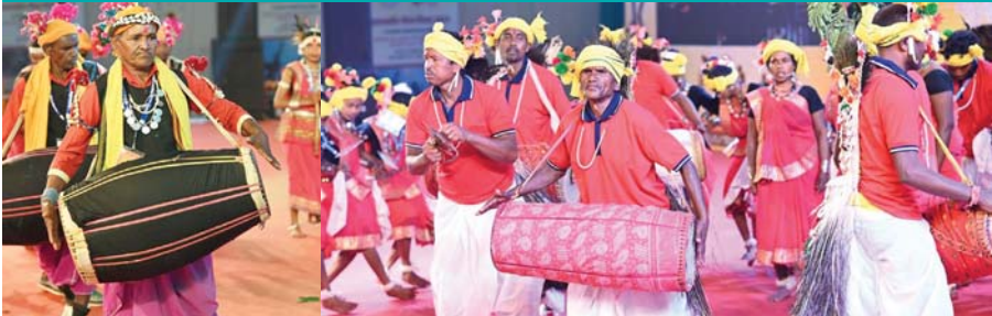
पायनियर संवाददाता रायपुर www.dailypioneer.com

विभिन्न राज्यों के जनजातीय नर्तक दलों ने शानदार प्रस्तुति से समा बांधा