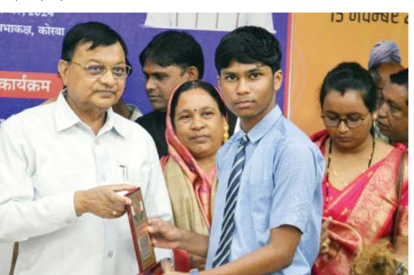
पायनियर संवाददाता कोरबा www.dailypioneer.com