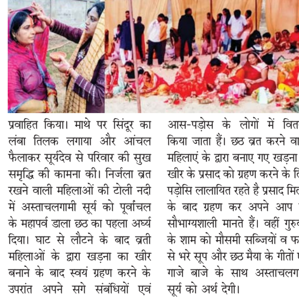
पायनियर संवाददाता < रायपुर www.dailypioneer.com

प्रवाहित किया। माथे पर सिंदूर का लंबा तिलक लगाया और आंचल फैलाकर सूर्यदेव से परिवार की सुख सम्झु की कामना की। निर्जला ब्रती रखने वाली महिलाओं की टोली नती में अस्ताचलगामी सूर्य को पूर्वांचल के महापर्व डाला छठ का पहला अर्घ्य दिया। घाट से लौटने के बाद ब्रती महिलाओं के द्वारा खड़ना का खीर बनाने के बाद स्वयं ग्रहण करने के उपरांत अपने सगे संबंधियों एवं