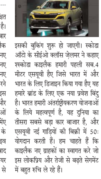
पायनियर संवाददाता < रायपुर www.dailypioneer.com

स्कोडा ऑटो इंडिया ने अपनी बहुप्रतीक्षित एसयूवी काइलैक का आनावरण किया है। इसे भारत और तुनिया में पहली बार सबसे सामने पेश किया गया है। काइलैक भारत में स्कोडा ऑटो के लिए एक नए युग की शुरुआत करेगी क्योंकि यह नए बाजारों में प्रवेश करने के साथ ही नए ग्राहकों को अपनी ओर आकर्षित करने वाली है। कंपनी ने इस साल फरवरी में इस एसयूवी की घोषणा के साथ भारत में और विस्तार करने की अपनी महत्वाकांक्षाओं की पुष्टि की थी। इस साल अक्टूबर में स्कोडा ऑटो इंडिया ने काइलैक के कैम्पोफ़ॉल्ट्री प्रोडक्शन वर्जन को झूझ चलाई थी। इसके एक महीने बाद काइलैक ने अब अपना वल्टेड प्रीमियर एडिशन है, और 2 दिसंबर 2024 से