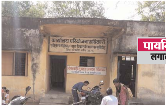
पायनियर संवाददाता < जांजीगीर चौपा www.dailypioneer.com

कार्यवाही के नाम पर हिला हवाला समझ से परे क्या मामला सच में पैसे का लेनदेन का??