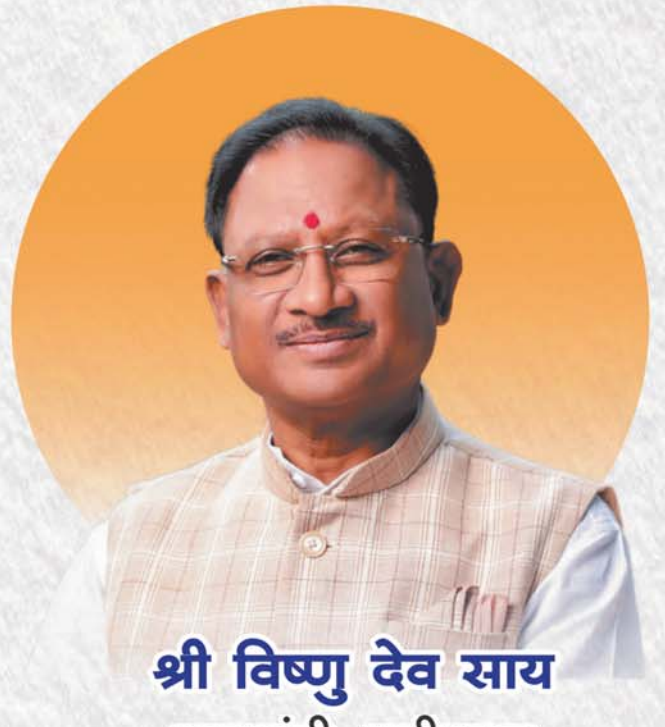
श्री विष्णु देव साय मुख्यमंत्री, छत्तीसगढ़