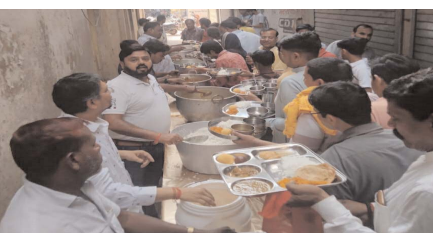
पायनियर संवाददाता < सक्ती www.dailypioneer.com

भगवान गोवर्धन जी की पूजा दिवस अन्नकूट का महापर्व जहां पूरे देश में उत्साह एवं धूमधाम के साथ मनाया गया तो वहीं रायगढ़ जिले के खरसिया शहर में भी इस दिन भगवान गोवर्धन जी की पूजा अर्चना करते हुए अन्नकूट महापर्व का आयोजन किया