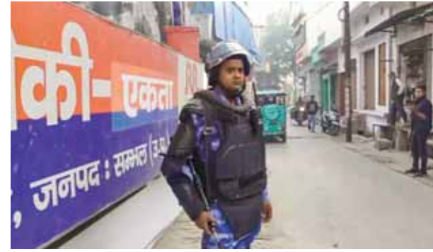
संभल में काजून व्यवस्था बनाए रखने के लिए खड़ा सुरक्षाबल का जवान

हिंसा के कारणों की पहचान करने के साथ-साथ आयोग भविष्य में ऐसी घटनाओं की पुनरावृत्ति को रोकने के लिए सिफारिशें भी देगा। 28 नवंबर को जारी अधिसूचना में