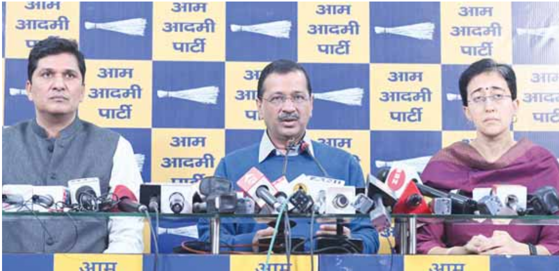
सीएम आतिथी और मंत्री सौरभ भारद्वाज की मौजूदगी में प्रेस वार्ता के दौरान आप संयोजक अरविंद केजरीवाल।

अतिथी ने लोगों की सेवा के लिए सरकार की प्रतिबद्धता को दोहराया, जबकि भारद्वाज ने दिव्यांगजनों को पांच हजार रुपए मासिक पेंशन देने के संबंध में योजना की घोषणा की।