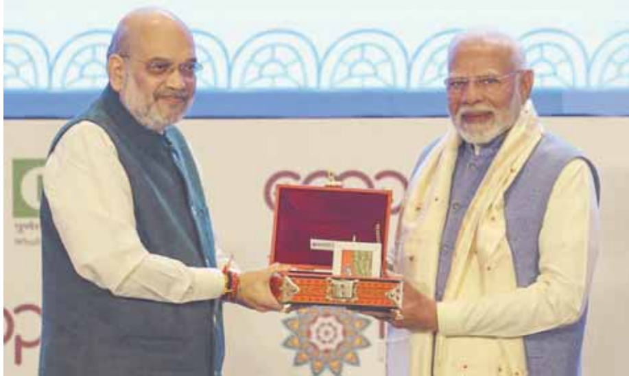
नई दिल्ली में आईसीए वैश्विक सहकारिता सम्मेलन में प्रधानमंत्री नरेंद्र मोदी और सहकारिता मंत्री अनुराग थाकुर