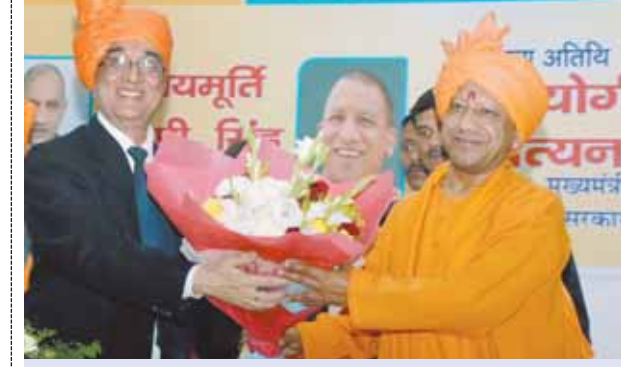
पायनियर समाचार सेवा। लखनऊ/वाराणसी

काल का चक्र किसी का इंतजार नहीं करता: सीएम