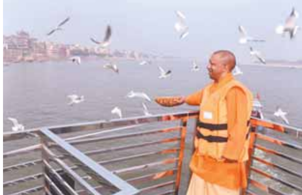
पायनियर समाचार सेवा। लखनऊ/वाराणसी

मुख्यमंत्री ने साइबेरियन पक्षियों को खिलाया दाना