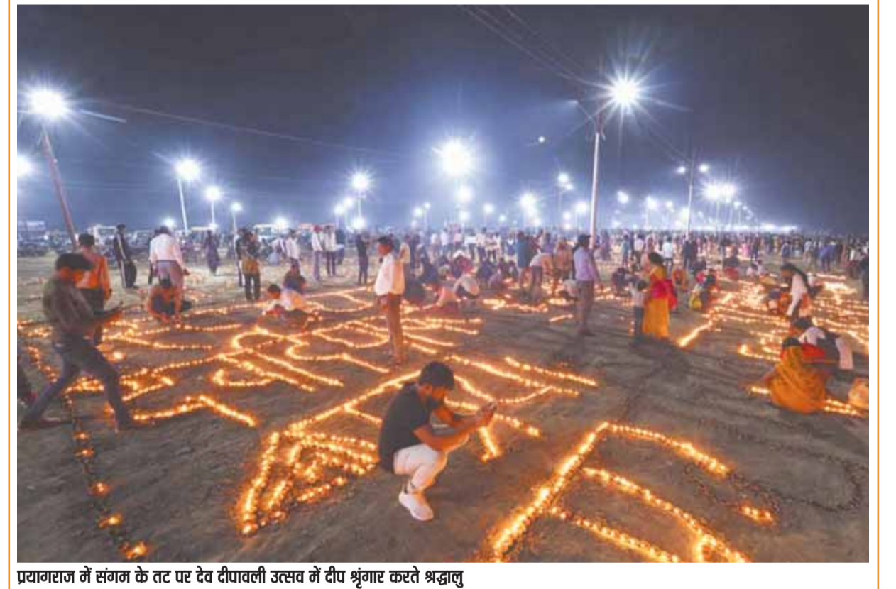
प्रयागराज में संगम के तट पर देव दीपावली उत्सव में टीप श्रृंगार करते श्रद्धालु