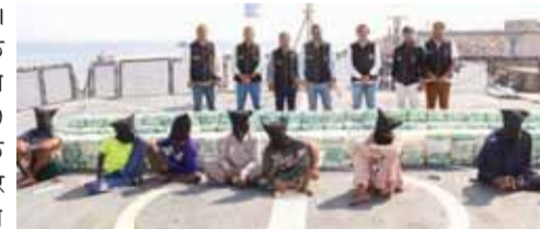
एनसीबी कर्मियों ने एक ऑपरेशन के बाद एक अंतरराष्ट्रीय मादक पदार्थ तस्करी गिरोह को साफलतापूर्वक ध्वस्त कर दिया और गुजरात तट लगभग 700 किलोग्राम नैपे जब्त किया। (विस्तृत खबर पृष्ठ-3)

पायनियर समाचार सेवा | नई दिल्ली। मादक पदार्थ रोधी एजेंसियों के एक संयुक्त अभियान के तहत शुक्रवार को गुजरात के तट के पास लगभग 700 किलोग्राम मादक पदार्थ जब्त होने के बाद आठ ईरानी नागरिकों को गिरफ्तार किया गया। हवाई नागरिकों के गिरफ्तार (एनसीबी) ने एक बयान जारी कर कहा कि खुफिया सूचनाओं के आधार पर सागर मंथन - 4 (शेष पृष्ठ 9)