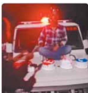
बोनट पर बैठा लोग

हड़कंप मच गया वीडियो में साफ तौर पर देखा जा सकता है की करीब दस लड़कों द्वारा गाली गलौज करते हुए सरकारी वाहन की लाल नीली बलियां जलती हुई और हटर बजाने को लेकर युवकों द्वारा गाली गलौज की जा रही है हालांकि इस दौरान मौजूद युवकों की के नाम बताने पर लोग कतरा रहे हैं जबकि सभी युवक नगर के ही बताये जा रहे हैं और कुछ पर