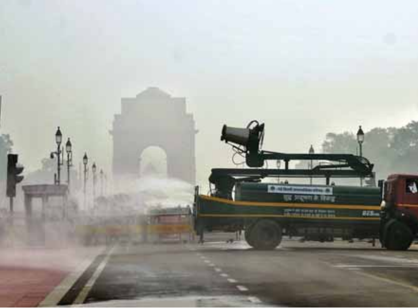
उद्देश्य से दिल्ली परिवहन निगम 106 अतिरिक्त क्लस्टर बसें संचालित करेगा जबकि मेट्रो ट्रेन 60 अतिरिक्त चक्कर लगाएंगी।

मंत्री ने बताया कि सार्वजनिक परिवहन को बढ़ावा देने और निजी वाहनों के उपयोग को कम करने के