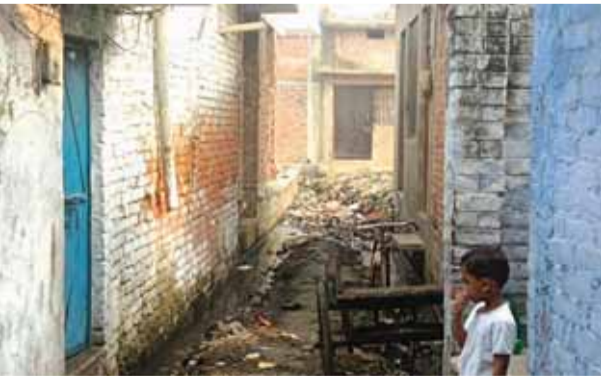
भीषण गंदगी और जलभराव का दृश्य

साथ ही साथ यहां सफ़ाईकर्म भी दिखाई नहीं देते जिसके कारण यहां तमाम तरह की गंदगी फैली दिखाई देती है। इस भीषण गंदगी और अस्व्हास्यकारी परिस्थितियों में सैकड़ों परिवार रहने के लिए विवश हैं। इसके अलावा यहां तमाम तरह की बीमारियों का भी प्रकोप है। लोगों ने बताया कि यहां मलेरियाए वायरल फ़ैवर और यहां तक की डेंगू भी फैला हैए जिसकी चपेट में तमाम