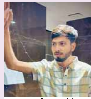
पुलिस को फाइल फोटो