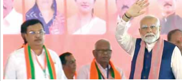
प्रधानमंत्री नरेंद्र मोदी शनिवार को अकोला जिले में आगामी महाराष्ट्र विधानसभा चुनाव के लिए चुनावी रैली के दौरान जनसभा को संबोधित करते हुए।

कृपया हमारे इस प्रस्ताव पर विचार करें, या तो 50 प्रतिशत या कम से कम 20 प्रतिशत हिस्सेदारी को एक ऐसे मूल्यांकन पर बेच दें, जो आपको दिए गए किसी भी प्रस्ताव से कहीं अधिक है। (शेष पृष्ठ 9)