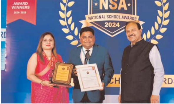
विषय है। 'राष्ट्रीय विद्यालयी पुरस्कार' के अंतर्गत दिल्ली वर्ल्ड पब्लिक स्कूल

रिंग रोड में अवस्थित स्थानीय दिल्ली वर्ल्ड पब्लिक स्कूल ने शिक्षा के मानक बिंदुओं को पूरा करते हुए एक और बड़ी उपलब्धि अपने नाम कर लिया। शिक्षा के क्षेत्र में नित नवीन एवं बेहतर प्रदर्शन के साथ बेस्ट प्र्यूचरिस्टिक एडुकेशन के क्षेत्र में राष्ट्रीय पुरस्कार अपने नाम करना, विद्यालय परिवार के साथ साथ क्षेत्रवासियों के लिए भी गौरव का