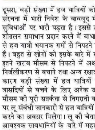
दूसरा, बड़ी संख्या में हज यात्रियों को सुविधाएँ देने के लिए ढांचागत संरचना में भारी निवेश के बावजूद मौसम का बहुत खराब होना इन सुविधाओं पर भारी पड़ता है। इससे उपयुक्त चिकित्सा देखभाल तथा शीतलन समाधान प्रदान करने में बाधा आती है। इसके साथ ही बहुत से हज यात्री भयानक गर्मी से निपटने के लिए ठीक से तैयार नहीं होते हैं। बहुत से लोगों को इसके बारे में समुचित जानकारी नहीं थी या वे इतने खराब मौसम से निपटने में अक्षम थे। उनको समुचित मात्रा में निर्जलीकरण से बचाने तथा अन्य रक्षात्मक उपायों की कमी थी जिसके कारण बड़ी संख्या में हज यात्रियों की मौत हुई। भविष्य में ऐसी त्रासदियों से बचने के लिए अनेक उपाय करने की आवश्यकता है। मौसम की पूरी सतर्कता से निगरानी की जानी चाहिए तथा सही समय पर लू संबंधी जानकारी से हज यात्रियों व अधिकारियों को बेहतर तैयारी करने का अवसर मिलेगा। लू की चेतावनियों को जीवन व्यवस्था तथा आवश्यक सावधानियों के बारे में महत्वपूर्ण सूचनाएँ देने से भविष्य में जोखिम को घटया जा सकता है। इसके साथ ही ढांचागत संरचना में व्यापक स्तर पर सुधार की जरूरत है। इसमें ज्यादा छायादार क्षेत्रों तथा 'कूलिंग सेंटर्स' की स्थापना शामिल है। इसके साथ ही इस बात के प्रयास आवश्यक हैं कि हज यात्रियों में निर्जलीकरण न होने पाए, उनको समुचित मात्रा में पानी और द्रव पदार्थ दिए जाएँ ताकि उनको गर्मी संबंधी स्वास्थ्य मुद्दों से सुरक्षा दी जा सके।

लू के विनाशकारी प्रभाव के कई कारण हैं। पहला, जलवायु परिवर्तन निरंतर स्पष्ट होता जा रहा है। इसके कारण अक्सर वैश्विक तापमान बढ़ने की घटनाएँ होती हैं तथा भयानक लू चलती है। इससे खासकर मध्यपूर्व में मौसम बहुत खराब हो जाता है तथा ऐसे आयोजन जानलेवा साबित हो सकते हैं। दूसरा, बड़ी संख्या में हज यात्रियों को सुविधाएँ देने के लिए ढांचागत संरचना में भारी निवेश के बावजूद मौसम का बहुत खराब होना इन सुविधाओं पर भारी पड़ता है। इससे उपयुक्त चिकित्सा देखभाल तथा शीतलन समाधान प्रदान करने में बाधा आती है। इसके साथ ही बहुत से हज यात्री भयानक गर्मी से निपटने के लिए ठीक से तैयार नहीं होते हैं। बहुत से लोगों को इसके बारे में समुचित जानकारी नहीं थी या वे इतने खराब मौसम से निपटने में अक्षम थे। उनको समुचित मात्रा में निर्जलीकरण से बचाने तथा अन्य रक्षात्मक उपायों की कमी थी जिसके कारण बड़ी संख्या में हज यात्रियों की मौत हुई। भविष्य में ऐसी त्रासदियों से बचने के लिए अनेक उपाय करने की आवश्यकता है। मौसम की पूरी सतर्कता से निगरानी की जानी चाहिए तथा सही समय पर लू संबंधी जानकारी से हज यात्रियों व अधिकारियों को बेहतर तैयारी करने का अवसर मिलेगा। लू की चेतावनियों को जीवन व्यवस्था तथा आवश्यक सावधानियों के बारे में महत्वपूर्ण सूचनाएँ देने से भविष्य में जोखिम को घटया जा सकता है। इसके साथ ही ढांचागत संरचना में व्यापक स्तर पर सुधार की जरूरत है। इसमें ज्यादा छायादार क्षेत्रों तथा 'कूलिंग सेंटर्स' की स्थापना शामिल है। इसके साथ ही इस बात के प्रयास आवश्यक हैं कि हज यात्रियों में निर्जलीकरण न होने पाए, उनको समुचित मात्रा में पानी और द्रव पदार्थ दिए जाएँ ताकि उनको गर्मी संबंधी स्वास्थ्य मुद्दों से सुरक्षा दी जा सके।