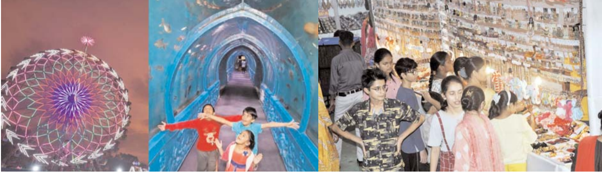
पायनियर संवाददाता रायपुर