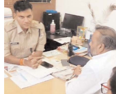
पायनियर संवाददाता रायपुर

रायपुर दक्षिण विधानसभा क्षेत्र अंतर्गत पुराना धमतरी मार्ग के संतोषी नगर ब्रिज के पास हमेशा यातायात बाधित होने के कारण जाम लगा रहता है जिससे कि वहां के रहवासी, व्यापारियों, स्कूल में पढ़ने वाले छात्र-छात्राओं एवं महिलाओं को आने-जाने में बहुत