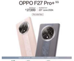
पायनियर संवाददाता रायपुर

ओपो इंडिया ने एफ27 प्रो+ 5जी पेश किया है। यह देश का पहला आईपी66, आईपी68 और आईपी69 रेटेड सुपर रड, मॉनसून रेडी स्मार्टफोन है। एफ27 प्रो+ दो रंगों - डस्क पिंक और मिडनाइट नैवी में मिलेगा और 128जीबी स्टोरेज के