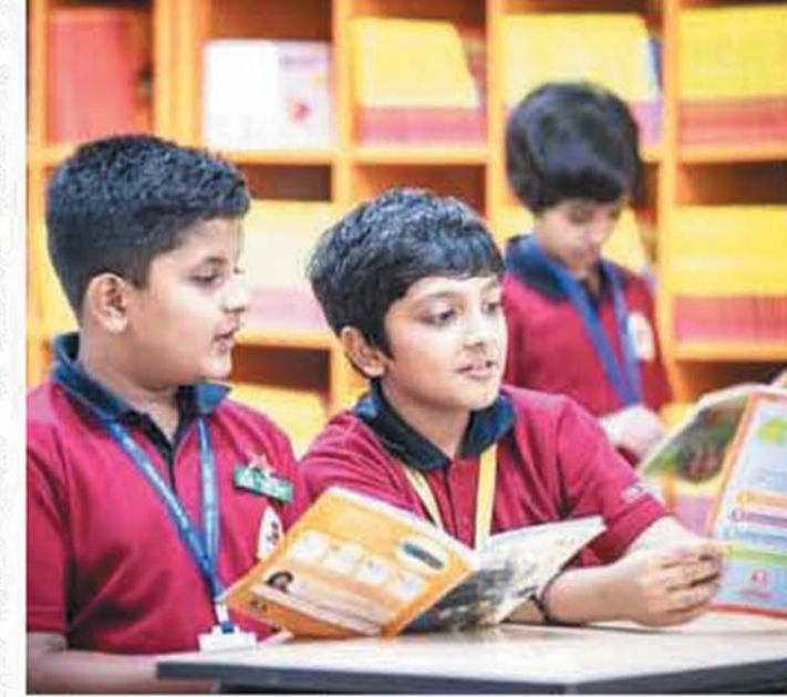
हालाँकि, ई-बुक के लिए एलेक्ट्रॉनिक उपकरणों की जरूरत होती है जो ऊर्जा का उपभोग करते हैं, लेकिन ऊर्जा-सक्षम उपकरणों के प्रयोग, चार्जिंग के लिए एलेक्ट्रॉनिक उपकरणों के संभावित पुनः प्रयोग से पर्यावरण प्रभाव कम किया जा सकता है।

पढ़ना उन लोगों के लिए जरूरी है जो सामान्य स्थिति से ऊपर उठना चाहते हैं। पढ़ने की आदत के जीवन पर अनेक सकारात्मक प्रभाव होते हैं जिनमें बौद्धिक प्रेरणा से लेकर भावनात्मक बेहदरी तक शामिल हैं। नियमित रूप से पढ़ने के लिए समय निकालना अपने लिए लाभदायक है, फिर चाहे वह भौतिक पुस्तकों से हो या ई-पुस्तकों से। बरखा और टैंडक के समय कम कंबल में बैठ कर और एक कप काफी हाथ में लेकर अपनी पसंदीदा पुस्तक पढ़ने से अधिक आनन्द और कुछ नहीं हो सकता है।