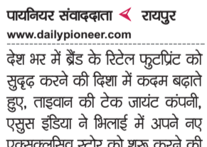
पायनियर संवाददाता रायपुर

देश भर में ब्रैंड के रिटेल फुटप्रिंट को सुदृढ़ करने की दिशा में कदम बढ़ाते हुए, ताइवान की टेक जायंट कंपनी, एएसुस इंडिया ने भिलाई में अपने नए एक्सवल्सिव स्टोर को शुरू करने की घोषणा की है। यह नवीनतम एक्सवल्सिव स्टोर 392 वर्ग फुट में फैला हुआ है, जो इलेक्ट्रॉनिक्स और कम्प्यूटर हार्डवेयर की एक विस्तृत श्रृंखला सहित एएसुस प्लेगेशिप स्ट्रैटेजी की पेशकश करने के लिए