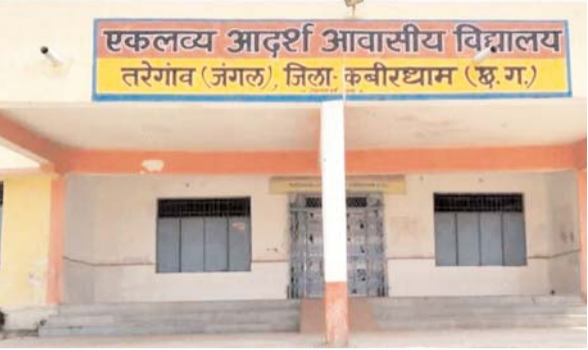
पायनियर संवाददाता < कवर्धा

नई दिल्ली प्रवर्तित एवं छत्तीसगढ़ राज्य स्तरीय आदिम जाति कल्याण, आवासीय एवं आश्रम शैक्षणिक संस्थान समिति द्वारा प्रदेश में एकलव्य आदर्श आवासीय विद्यालयों का संचालन किया जा रहा है। इसका मुख्य उद्देश्य जनजातीय वर्ग के विद्यार्थियों को उत्कृष्ट शिक्षा प्रदान किया जाकर सर्वांगीण विकास करना है। जिसके लिए प्रति विद्यार्थी एक साल में लगभग तीस हजार