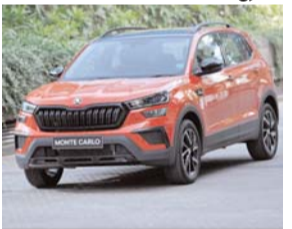
पायनियर संवाददाता रायपुर

स्कोडा ऑटो इंडिया ने ब्रैंड को ज्यादा से ज्यादा लोगों तक पहुंचाने की अपनी पहलों को जारी रखते हुए, सीमित अवधि के लिए कुशाक और स्लाविया की नई कीमतों की घोषणा की है। इससे उपभोक्ताओं की स्कोडा ऑटो इंडिया की उन गाड़ियों तक पहुंच बढ़ी है, जिन्हें 5 स्टार रेटिंग दी