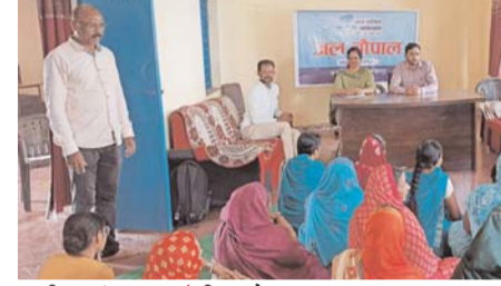
पायनियर संवाददाता तिलदा-नेवरा