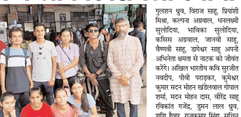
पायनियर संवाददाता < धमतरी www.dailypioneer.com