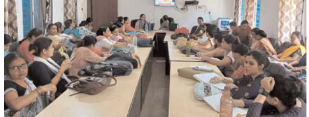
पायनियर संवाददाता < सक्ती www.dailypioneer.com