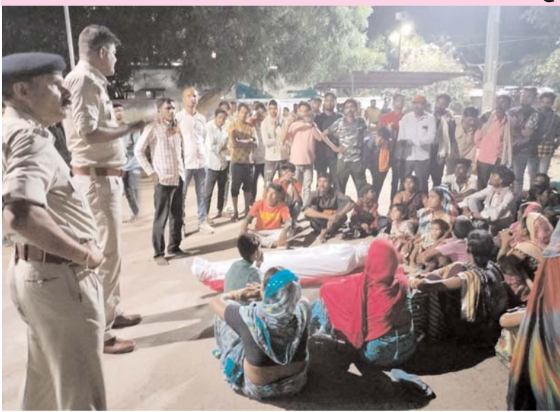
पायनियर संवाददाता < भाटापारा www.dailypioneer.com

विगत कुछ दिनों से पुलिस के विवादस्पद कार्यप्रणाली के चलते आम जनता के मन में पुलिस के प्रति विश्वासीयता की कमी देखी जा रही है जिसके चलते आम जनता को थाने का घेराव व धरना प्रदर्शन जैसे गतिविधियों को बल मिल रहा है