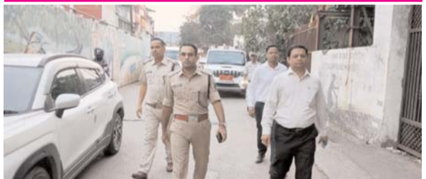
पायनियर संवाददाता < रायगढ़ www.dailypioneer.com