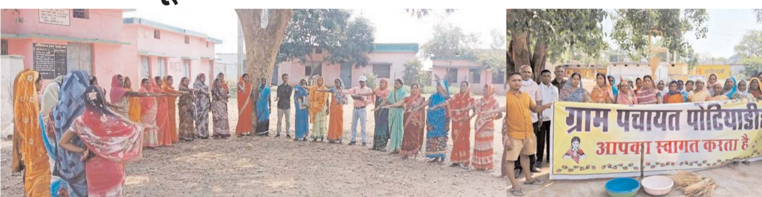
पायनियर संवाददाता < धमतरी www.dailypioneer.com