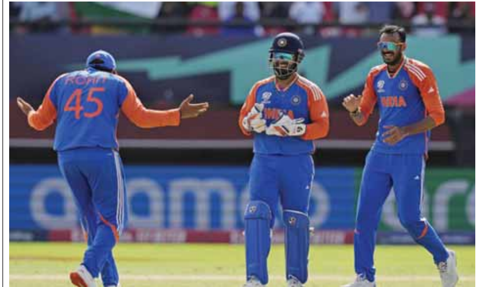
इंग्लैंड की टीम का टिकट लेने के बाद प्रसन्नता व्यक्त करते भारतीय टीम के खिलाड़ी