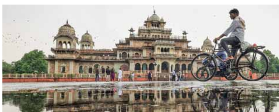
नई दिल्ली में बृहस्पतिवार सुबह भारी बारिश के बाद कई स्थानों पर जलजमाव हो गया

35.4 डिग्री सेल्सियस दर्ज किया गया, जो सामान्य से 1.8 डिग्री कम है। दिल्ली में न्यूनतम तापमान 28.6 डिग्री सेल्सियस दर्ज किया गया। ताप सूचकांक या तापमान 44.9 डिग्री सेल्सियस दर्ज किया गया। सापेक्षिक आर्द्रता 82 प्रतिशत से 61 प्रतिशत के बीच रही। भारत मौसम विज्ञान विभाग (आईएमडी) ने पहले दिन में अनुमान लगाया था कि दिल्ली और आसपास के इलाकों में मध्यम से भारी बारिश के कारण सड़कों पर फिसलन, कम दृश्यता, यातायात में व्यवधान और निचले इलाकों में स्थानीय जलजमाव होगा। भारी बारिश के बीच, शहर के यातायात जाम की सूचना मिली। सड़क पर वाहन रेंगते नजर आए। इसी तरह अक्षरधाम-सराय काले खां रोड