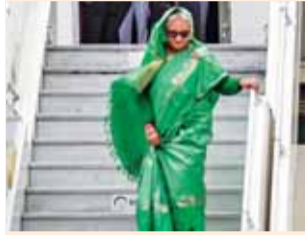
नई दिल्ली। बांग्लादेश की प्रधानमंत्री शेख हसीना 9 जून को शाम को प्रधानमंत्री के रूप में नरेंद्र मोदी के शपथ ग्रहण समारोह में भाग लेने के लिए शनिवार दोपहर नई दिल्ली पहुंचीं। भारत ने शुरुआत को औपचारिक रूप से घोषणा की कि पड़ोस और हिंद महासागर क्षेत्र के सात देशों के नेता इस समारोह में भाग लेंगे। विदेश मंत्रालय (एमईए) के अनुसार, श्रीलंका के राष्ट्रपति रानिल विक्रमसिंघे, उनके मालदीव समकक्ष मोहम्मद मुइजुजू, बांग्लादेशी प्रधानमंत्री शेख हसीना और नेपाली प्रधान मंत्री पुष्प कमल देहल प्रचंड समारोह में भाग लेंगे। ऐसा पता चला है कि मोदी के आने वाले नेताओं के साथ अलग-अलग बैठकें करने की उम्मीद है। इसमें कहा गया है कि मॉरीशस के प्रधानमंत्री प्रविंद कुमार जुगनाथ, उनके भूटानी समकक्ष शेरिंग तोग्योर और सेरोल के उपराष्ट्रपति अहमद अलीफ ने भी शपथ ग्रहण समारोह में शामिल (शेष पेज 9)