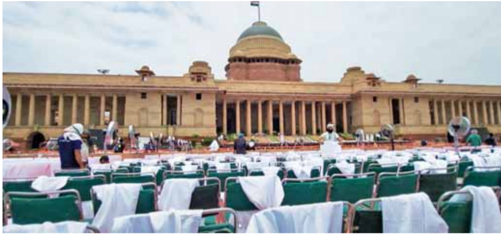
नई दिल्ली में राष्ट्रपति भवन में नई सरकार के शपथ ग्रहण समारोह की घल रही तैयारीयों।