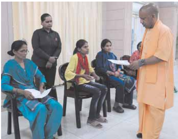
समस्याओं से अवगत कराया। मुख्यमंत्री अपने सरकारी आवास पर 'जनता दर्शन' योगी आदित्यनाथ ने शनिवार सुबह ही में पहुंचे प्रत्येक पीड़ितों से मुलाकात की।

मुख्यमंत्री योगी आदित्यनाथ ने शनिवार को भी अपने सरकारी आवास पर 'जनता दर्शन' किया। इस दौरान प्रदेश के विभिन्न कोनों से पहुंचे सैकड़ों लोगों ने मुख्यमंत्री को अपनी पीड़ा सुनाई। सीएम ने प्रत्येक पीड़ितों से मिलकर उनकी समस्याओं को सुना और संबंधित अधिकारियों को समयसमया के अंदर समाधान के निर्देश दिए। जनता दर्शन कार्यक्रम में महिलाएं, पुरुष व युवाओं ने अपनी-अपनी