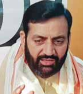
हरियाणा के मुख्यमंत्री नायब सिंह सैनी भर्ती प्रक्रिया की प्रणाली को जारी रखा जाएगा।