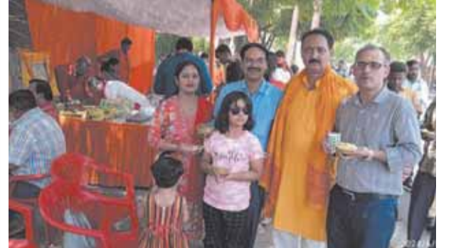
अलीगंज में हनुमान भक्तों ने शनिवार को भंडारे का आयोजन किया