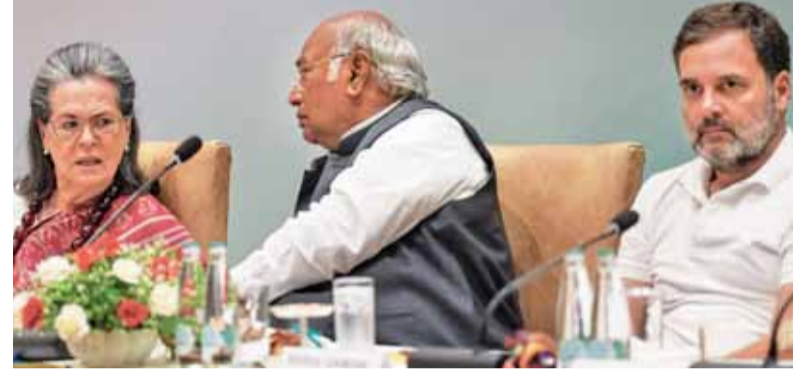
कांग्रेस कार्यसमिति की बैठक में कांग्रेस अध्यक्ष मल्लिकार्जुन खड़गे के साथ सोनिया गांधी और राहुल गांधी।