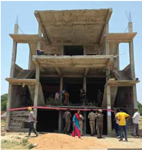
चारों निर्माण जिस क्षेत्र में किये जा रहे हैं, वह क्षेत्र अंसल एपीआई हाईटेक टाउनशिप में आता है। अंसल एपीआई के सक्षम अधिकारियों से जवाब.तलब किया गया तो पता चला कि उक्त सभी निर्माण कार्य निजी बिल्डरों द्वारा अवैध रूप से किये जा रहे हैं। अंसल द्वारा न तो उन लोगों को जमीन बेची गयी है