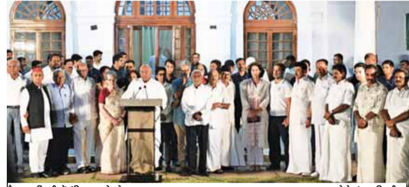
फायन: दिल्ली में इंडिया गुट के नेता।

प्रकाशन भी सदस्यों को साफ्ट संस्करण में उपलब्ध कराये जायेंगे। बाहरी क्षेत्रों के पुनर्विकास के हिस्से के रूप में महात्मा गांधी, छत्रपति शिवाजी और महात्मा ज्योतिबा फुले सहित राष्ट्रीय प्रतीकों की मूर्तियों को पुराने संसद भवन के गेट नंबर 5 के पास एक लॉन में ले जाया गया है। इससे संविधान सदन नाम दिया गया है। इससे गज द्वार के सामने एक विशाल लॉन के निर्माण का मार्ग प्रशस्त हो गया है, जिसका उपयोग राष्ट्रपति और प्रधानमंत्री द्वारा नए संसद भवन में प्रवेश के लिए किया जाता है। लॉन का उपयोग एनेक्सी एक सड़क (शेष पेज 9)