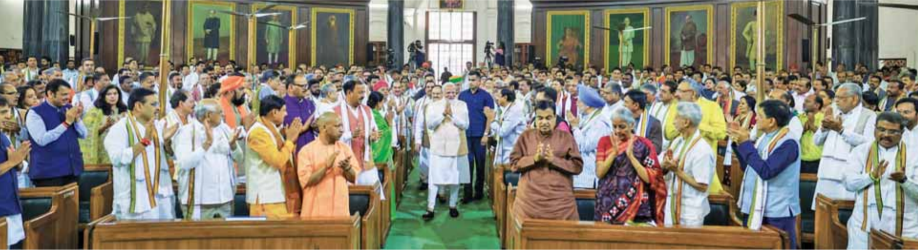
नई दिल्ली में शुक्रवार एनडीए संसदीय दल की बैठक में भाग लेने पहुंचे प्रधानमंत्री नरेंद्र मोदी।