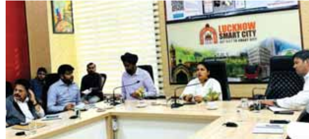
मैं गुणवत्ता का विशेष ध्यान रखते हुए नोडल अधिकारी नियमित रूप से कार्यों की मॉनिटरिंग करते रहे। उन्होंने सख्त निर्देश दिये हुए कहा कि फेल्ड पर उतरकर संबंधित अधिकारी निर्माणधीन कार्यों का निरीक्षण स्वयं करें। मंडलायुक्त को संबंधित अधिकारियों द्वारा अवगत कराया गया कि केडी सिंह बाबू स्टेडियम में चल रहे सिविल कार्य में बॉक्सिंग रिंग व ताइक्वांडो हाल के समस्त सिविल कार्य शतप्रतिशत पूर्ण करा लिये गये।

मंडलायुक्त की अध्यक्षता में स्मार्ट सिटी कार्यों की समीक्षा बैठक की गयी। मंडलायुक्त द्वारा निर्माणधीन कार्यों को गुणवत्ता पूर्वक व निर्धारित समयवाधि में समस्त कार्यों को पूर्ण कराने के निर्देश दिये गए। साथ ही मंडलायुक्त द्वारा संबंधित अधिकारी स्वयं कार्यों की मॉनिटरिंग नियमित रूप से करते रहे। शुक्रवार को मंडलायुक्त डॉ रोशन जैकब की अध्यक्षता में स्मार्ट सिटी कार्यों की महत्वपूर्ण समीक्षा बैठक स्मार्ट सिटी कार्यालय में की गई। मंडलायुक्त ने स्मार्ट सिटी के कार्यों की गहनता से समीक्षा करते हुए संबंधित अधिकारियों को निर्देश दिए गए कि निर्माणधीन समस्त कार्य समयम पूर्ण करा लिये जायें एवं निर्माणधीन कार्यों