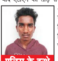
पुलिस के हथे चढ़ा युवक

राजनांदगांव। रविवार - सोमवार की दरम्यान रात सोमनी में एटीएम से चारी के मामले में पुलिस ने एक आरोपी को गिरफ्तार किया है। पुलिस अधिकारियों ने बताया कि युवक शटर तोड़ने के बाद एटीएम को तोड़ पाने का प्रयास कर रहा था लेकिन वह