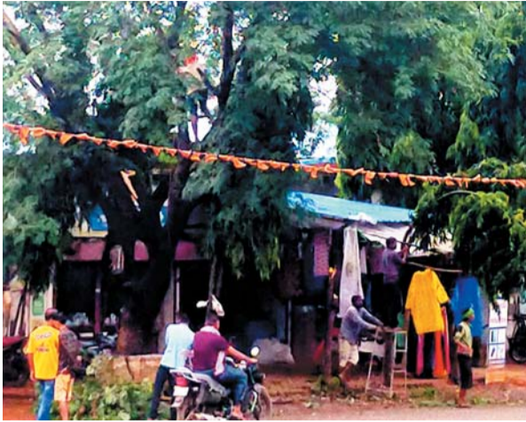
वृक्षों पर सोमवार को एक स्वार्थी वर्ग की नजर लग गई, और बाँगेर अनुमति के ही लगभग 4 से 5 लोगों ने मिलकर सिरिज व अशोक के वृक्ष को काटना प्रारंभ कर दिया। कामगारों ने 2 अशोक वृक्ष को

देशभर में इन दिनों एक पेड़ माँ के नाम पौधारोपण अभियान जारी है। इस अभियान के अंतर्गत राज्य में व्यापक पैमाने में पौधारोपण किये जा रहे हैं। जिला प्रशासन भी पौधारोपण को लेकर बेहद संजीदगी से पौधारोपण में जुटा हुआ है। इसी क्रम में नगर व अंचल में भी पौधारोपण हुए हैं। हालांकि एक वर्ग पौधारोपण के विपरीत पूर्व से ही नगर के मेनरोड किनारे आच्छादित वृक्षों को काट कर अभियान की धज्जियाँ उड़ा रहा है। दरअसल नगर के मेनरोड में स्थित नगर पंचायत के पुराने भवन के सामने परिसर में सिरिज व अशोक के वृक्ष शोभायमान थे। इन