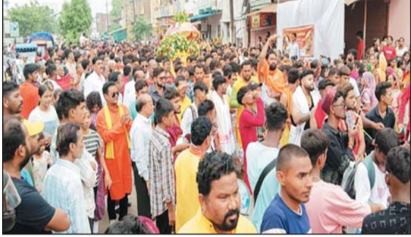
विभिन्न वेशभूषा में शिवगण का रूप धरे लोग भी शामिल हुए जो आकर्षण का केंद्र रहे। इस दौरान

भगवान चंद्रमौलेश्वर की पालकी यात्रा आज बसंतपुर क्लब हाउस से निकली। यात्रा दोपहर 02 बजे शुरू होकर महामाया चौक, प्रभात नगर होते हुए हेमकलाणी नगर, लालबाग सिंधी कॉलोनी स्थित शिव मंदिर पहुंची जहां यात्रा ने विश्राम लिया। इस दौरान बड़ी संख्या में श्रद्धालु शामिल हो। जाह-जगह पर यात्रा का स्वागत किया गया वे चंद्रमौलेश्वर के दर्शन लोगों को मिले। यात्रा में