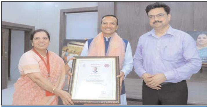
तिरंगा जन-जन तक पहुंचाने के लिए उपराष्ट्रपति जगदीप धनखड़ ने की नवीन जिन्दल की तारीफ

दिल्ली विश्वविद्यालय के हंसराज कॉलेज के 77वें स्थापना दिवस समारोह में कुरुक्षेत्र के सांसद और देश के अग्रणी उद्योगपति नवीन जिन्दल को महात्मा हंसराज गौरव सम्मान से अलंकृत किया गया। इस अवसर पर राष्ट्रीय ध्वज तिरंगा के लिए लंबा कानूनी संघर्ष करने और उसे जन-जन तक पहुंचाने के लिए नवीन जिन्दल के अथक प्रयासों की उपराष्ट्रपति जगदीप धनखड़ ने मंच से भरपूर तारीफ की। राजनीति, उद्योग, शिक्षा जगत और पोलो, निशानेबाजी जैसे खेलों को एक नई ऊंचाई पर पहुंचाने वाले कुरुक्षेत्र के सांसद नवीन जिन्दल को हंसराज कॉलेज ने दो दिन पूर्व अपने 77वें स्थापना दिवस पर खास मेहमान के रूप में आमंत्रित किया था। जिन्दल ने इसी कॉलेज से कॉमर्स में डिग्री हासिल की है। अपने इस होनहार छात्र की उपलब्धियों को देखते हुए हंसराज कॉलेज ने नवीन जिन्दल को महात्मा हंसराज गौरव सम्मान से अलंकृत किया। यह सम्मान उन्हें