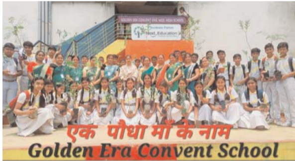
पायनियर संवाददाता < रायगढ़ www.dailypioneer.com

पूरे प्रदेश भर में पौधारोपण कार्यक्रम जो शेर से मुहिम चलाए जा रहा है। ताकि कि गर्मियों के मौसम में पेड़ पौधे लगाने से गर्म हवाओं से राहत मिल सके। क्योंकि मनुष्यों का जीवन प्राकृतिक संरचनाओं के रूप में है। वहीं एक पौधा मां के नाम से गोल्डन एरा कॉन्वेंट इंग्लिश मीडियम हाई स्कूल चांपा के शिक्षकों एवं छात्र छात्राओं के द्वारा कार्यक्रम संपन्न किया गया। जिसमें छात्र-छात्राओं के द्वारा एक पौधा मां के नाम से लगाने मुहिम में बह-चक्र भाग लिया गया। स्कूल की छात्र छात्राओं के द्वारा एक पौधा मां के नाम से एक-एक पौधा अपने घरों के आंगनों में पौधारोपण करने के लिए तत्पर दिखाई दिए गोल्डन एरा कॉन्वेंट इंग्लिश