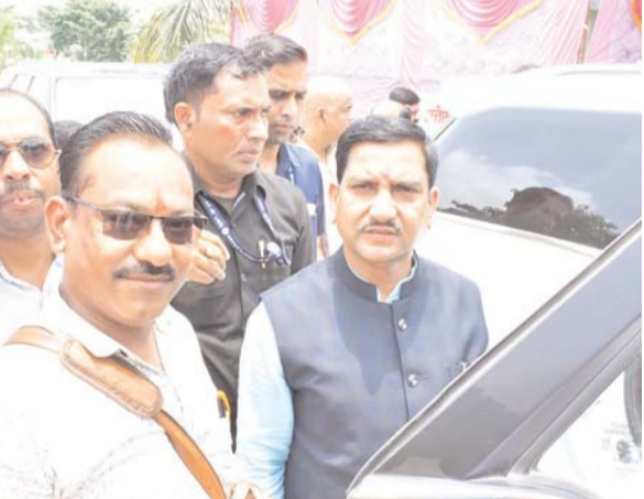
पायनियर संवाददाता < मुंगेली www.dailypioneer.com

सहारा निवेशकों ने भुगतान को लेकर केंद्रीय राज्य मंत्री तोखन साहू से चर्चा की। इस दौरान सहारा पीड़ित जमाकर्ता एवं कार्यकर्ता कल्याण संघ के लोगों ने बताया कि मुख्यमंत्री विष्णुदेव साय ने प्रदेश व मुंगेली जिले के सभी जमाकर्ताओं को जल्द पोटल की जटिल प्रक्रिया को सरल