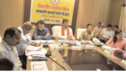
अगली बार जब भी मैं बालोद प्रवास पर आऊ तो अधिकारी सारे कार्य कर लें: विजय शर्मा

पहली बार बालोद पहुंचे सूबे के उप मुख्यमंत्री एवं प्रभारी मंत्री विजय शर्मा ने कार्य में लापरवाही बरत रहे और भ्रष्ट अधिकारियों को बड़ा संदेश दिया है कि लापरवाही किसी भी हाल बर्दाश्त नहीं की जाएगी। प्रभारी मंत्री के इस कड़े तेवर से लापरवाह एवं भ्रष्ट अधिकारियों में हड़कंप मच गया है। दरअसल