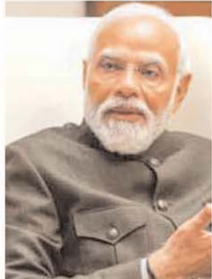
गौरव वल्लभ (लेखक, प्रोफेसर व राजनेता हैं)