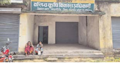
लिये जिले में बैठे जिम्मेदार जिला पंचायत सीईओ कलेक्टर का भी इस ओर कोई ध्यान नहीं है बताया जा रहा है की सीईओ साहब रोजना मडवा से बम्हनीडीह सरकारी गाड़ी से आना-जाना करते है।

शासन द्वारा सक्त निर्देश दिया गया है की ब्लाक मुख्यालय में निवास कर अपनी ड्यूटी करना है पर बम्हनीडीह ब्लाक मुख्यालय के सभी प्रमुख अधिकारी कर्मचारी अपने निजी निवास से आना-जाना करते है तो वहीं बम्हनीडीह सीईओ ने तो सरकारी गाड़ी को ही अपने आने जाने का साधन बना रखा है सीईओ साहब रोजना सरकारी गाड़ी से कार्यालय आते है जब की गाड़ी उनके दौरे के लिये अधिग्रहण की गई है पर सरकारी पैसे का डीलज डलवा कर शासन की राशि का खूब दुरुपयोग किया जा रहा है पर सीईओ साहब के इस लापरवाही को रोकने के