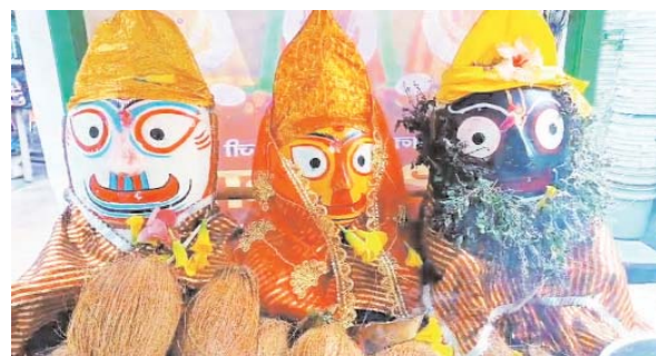
पायनियर संवाददाता < मुंगेली www.dailypioneer.com

नगर सहित आसपास के क्षेत्रों में भगवान जगन्नाथ की रथ यात्रा बड़ी धूमधाम से निकाली गई, इसके लिए श्रद्धालुओं का सुबह से ही नगर के जगन्नाथ मंदिर में आनाजना प्रारम्भ हो गया था, मंदिर में पूजा अर्चना के पश्चात भगवान जगन्नाथ बलभद्र एवं सुभद्रा