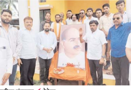
पायनियर संवाददाता बेमेतरा

जन संघ के संस्थापक पं. श्यामा प्रसाद मुखर्जी जी की जन्म जयंती बेमेतरा भाजपा कार्यालय में मनाया गया। उपस्थित कार्यकर्ताओं ने उनकी तैलचित्र पर पुल चढ़ाकर श्रद्धा सुमन अर्पित किये। इस अवसर पर भाजपा नेताओं ने उनके राजनैतिक जीवन के बारे में भाषन किया। उन्होंने कहा कि श्यामा प्रसाद मुखर्जी केन्द्रीय मंत्री थे। उन्होंने अपने मंत्री पद से इस्तीफा देकर जनसंघ की स्थापना की और बाद में वही जनसंघ की दिया छाप पार्टी 1980 में भारतीय जनता पार्टी बनी। मुखर्जी जी ने जनसंघ की स्थापना राष्ट्रवाद एवं हिन्दुत्व के विचारधारा को लेकर की थी। उनको लगा की कांग्रेस जो उस समय का बहुत बड़ा राजनैतिक दल था और उसको बेहतर