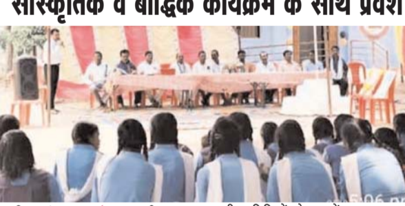
पायनियर संवाददाता सरायपाली