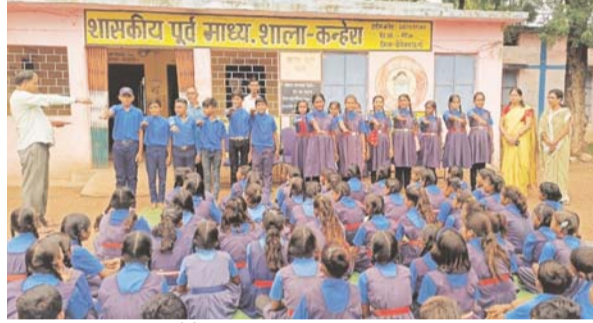
पायनियर संवाददाता < बेमेतरा www.dailypioneer.com

बैंगलेश डे पर शासकीय पूर्व माध्यमिक शाला कन्हैरा, विख-साजा, जिला-बेमेतरा में बाल संसद का गठन किया गया, जिसमें सर्वसम्मति से शाला के बच्चों द्वारा