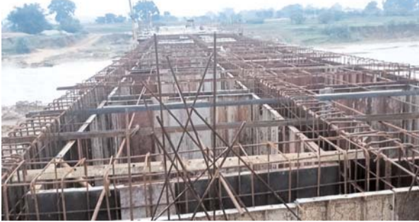
पायनियर संवाददाता < जशपुरकवार www.dailypioneer.com

बहु प्रतीक्षित डांडटोली और कुजरी पुलिया बनाने शासन ने किए 14 करोड़ स्वीकृत