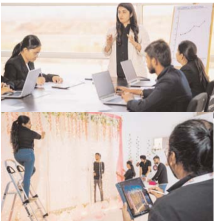
पायनियर संवाददाता रायपुर

एएफटी विश्वविद्यालय का मिशन हमेशा से युवाओं को प्रेरित करना रहा है ताकि वे अपने आप को एक बेहतर रूप में ढाल सकें। इससे उन्हें एक ऐसे कल की कल्पना करने में मदद मिलती है जहाँ वे मीडिया और कला समुदाय में