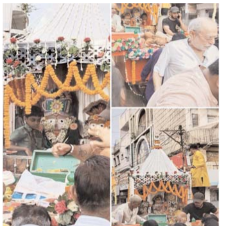
यात्रा मावली माता चौक समिति बलौदा बाजार द्वारा निकाली जाती है

भगवान जगन्नाथ की रथ यात्रा मावली माता मंदिर से प्रारंभ होते हुए बजरंग चौक सराफा बाजार गांधी चौक आजाद चौक नेहरू चौक बस स्टैंड गार्डन चौक सिविल लाइन होते हुए वापस मावली माता मंदिर पहुँची बड़ी संख्या में भक्त जनों ने भगवान जगन्नाथ का रथ खींचा भगवान जगन्नाथ जी को सुबह सिंगर किया गया था रथ को फूल मालाओं से सजाया गया था भोग के रूप में मूंग चना गुड का मिश्रण कर प्रसाद वितरित किया गया रथ खींचने के लिए लोगों में होड़ लगी हुई थी। विश्व प्रसिद्ध भगवान जगन्नाथ की रथ यात्रा में नगर भ्रमण करने के लिए भगवान जगन्नाथ अपनी बहन सुभद्रा और भाई बलराम संग निकलेंगे, फिर मावली माता के मंदिर में प्रवेश करेंगे जहाँ पर कुछ दिनों के लिए आराम करेंगे। यह रथ यात्रा हिंदू धर्म में विशेष स्थान रखता है। यह रथ