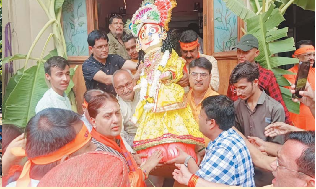
राजनांदगांव। जगत नाथ ने अपने बड़े भ्राता बलभद्र और बहन सुभद्रा के साथ आज नगर भ्रमण किया। रवि पुष्य नक्षत्र योग में इस पवित्र पर्व में भक्तों की भीड़ उमड़ी। जगन्नाथ के रथ रिंघने सभी आतुर रहे। प्रभु की दिव्यता से नगरी पवित्र हो गई। मार्ग पर भगवान की पूजा-अर्चना की गई। भ्रमण हेतु निर्धारित रास्ते पर जगह-जगह यात्रा का स्वागत किया गया। अपने आराध्य के ये दर्शन पाकर श्रद्धालुओं की आंखें छलक उठीं। 85 वर्षों से शहर में निरंतर आयोजित होने वाले इस उत्सव पर संस्कारधानी आनंदित हो उठी। 10 दिनों तक अब प्रभु जूनी हट्टी स्थित राम-जानकी मंदिर में निवास करेंगे। तत्पश्चात उन्हें पुनः राजसिक यात्रा के साथ मंदिर लाया जाएगा।