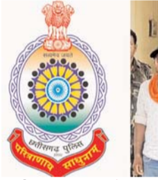
पायनियर संवाददाता < रामानुजगंज www.dailypioneer.com

भवरमाल धान खरीदी केंद्र में खरीफ वर्ष 2023-24 में 77 लाख रुपए का 11 व्यक्तियों के द्वारा गमन किया गया था इसके बाद फूड इंस्पेक्टर के रिपोर्ट पर पुलिस ने उनके विरुद्ध मामला दर्ज करते हुए उनकी तलाश शुरू कर दी गई थी जिसमें से चार आरोपियों को गिरफ्तार कर लिया गया है। हैरानी की बात यह है कि रामानुजगंज पुलिस के द्वारा दर्ज किए गए एफ.आर.आई.कापी को छत्तीसगढ़ पुलिस वेबसाइट पर छत्तीसगढ़ नागरिक को