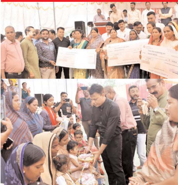
पायनियर संवाददाता बलौदा

सौगातों से भरा रहा कुरदी में आयोजित जिला स्तरीय जनसमस्या निवारण शिविर, 770 आवेदनों में मौके पर 192 आवेदन निराकृत