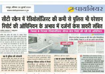
सीटी स्कैन में रेडियोलॉजिस्ट की कमी से पुलिस भी परेशान रिपोर्ट की ओपिनियन के अभाव में दर्जनों केस डायरी लॉक