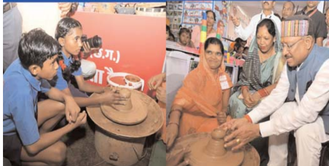
बच्चों के हुनर और प्रसूति की सराहना की, राज्य स्तरीय शाला प्रवेश उत्सव में स्टॉल का किया अवलोकन