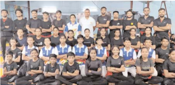
पायनियर संवाददाता < दल्लीराजहरा www.dailypioneer.com

राज्य स्तरीय कलारिप्यत्तू प्रतियोगिता का आयोजन 6 जुलाई से 9 जुलाई तक कोरबा (कुसमुंड) में आयोजित है, इसमें बालोद जिला के 36 खिलाड़ी हिस्सा लेंगे। जिसमें मार्शल आर्ट क्लब दल्ली राजहरा के 21 खिलाड़ी एवं शहीद वीर नारायण क्लब बालोद के 15 खिलाड़ी हिस्सा लेंगे। इन खिलाड़ियों का चयन 23 जून 2024 को मार्शल आर्ट क्लब