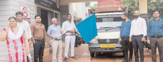
पायनियर संवाददाता < बेमेतरा