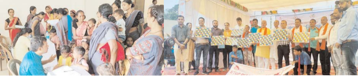
पायनियर संवाददाता < कवर्धा www.dailypioneer.com

कलेक्टर ने स्वामी विवेकानंद स्कूल रेंगाखार में आकांक्षी विकासखंड शिविर कार्यक्रम का आयोजन किया गया जिसमें डायरिया से संबंधित स्वास्थ्य संवर्धन खेल सांप-सीडी का विमोचन किया। जिससे खेल के माध्यम से बच्चे डायरिया से संबंधित जानकारी और बचाव के तरीके को