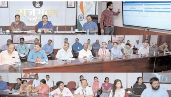
प्रशिक्षण में उपस्थित चिपस के प्रशिक्षणकर्ताओं ने सभी शंकाओं का उचित समाधान किया। प्रशिक्षण में उपस्थित

डिजिटल सचिवालय परियोजना के क्रियान्वयन हेतु राजभवन के अधिकारियों-कर्मचारियों को चिपस द्वारा प्रशिक्षण दिया गया। चिपस द्वारा सामान्य प्रशासन विभाग के मार्गदर्शन में एचआरएमएस सॉफ्टवेयर विकसित किया गया है, जिसमें अवकाश के लिए आवेदन, उपलब्ध संपत्ति विवरण और गोपनीय प्रतिवेदन ऑनलाइन भेजा जा सकेगा। राजभवन में ही डिजिटल एचआरएमएस सॉफ्टवेयर के संचालन हेतु आभ्यन्तरिक तैयारी की जा रही है। इसी सिलसिले में यह प्रशिक्षण आयोजित किया