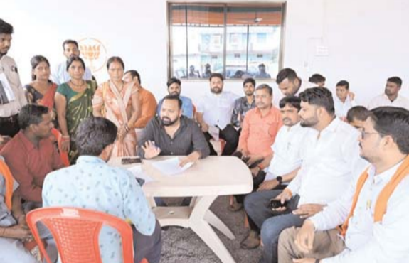
पायनियर संवाददाता < बेमेतरा www.dailypioneer.com

भाजपा नेताओं ने नगर पालिका के विभिन्न समस्याओं को लेकर विधायक से की चर्चा