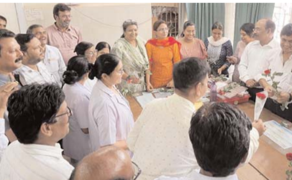
पायनियर संवाददाता < दल्लीराजहरा www.dailypioneer.com