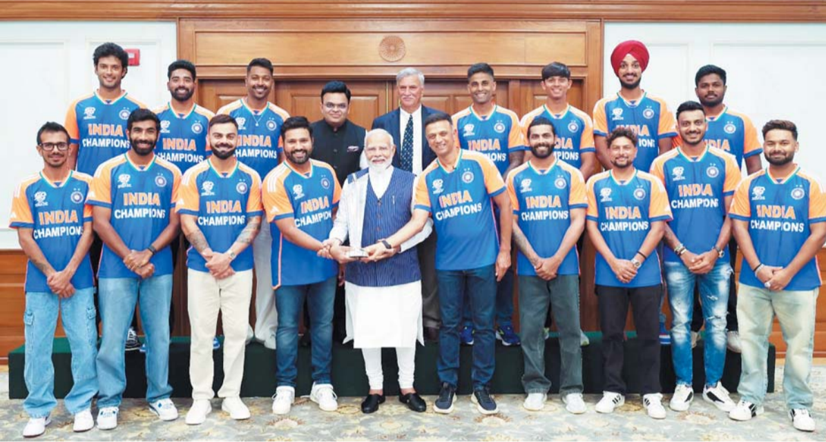
पार्यायनियर संवाददाता नयी दिल्ली www.dailypioneer.com

आवास पर मुलाकात की। भारतीय क्रिकेट कंट्रोल बोर्ड (बीसीसीआई) के अध्यक्ष रोजर बिन्नी और सचिव जय शाह ने प्रधानमंत्री को नमो वन की जर्सी भेंट की। भारतीय क्रिकेट टीम के