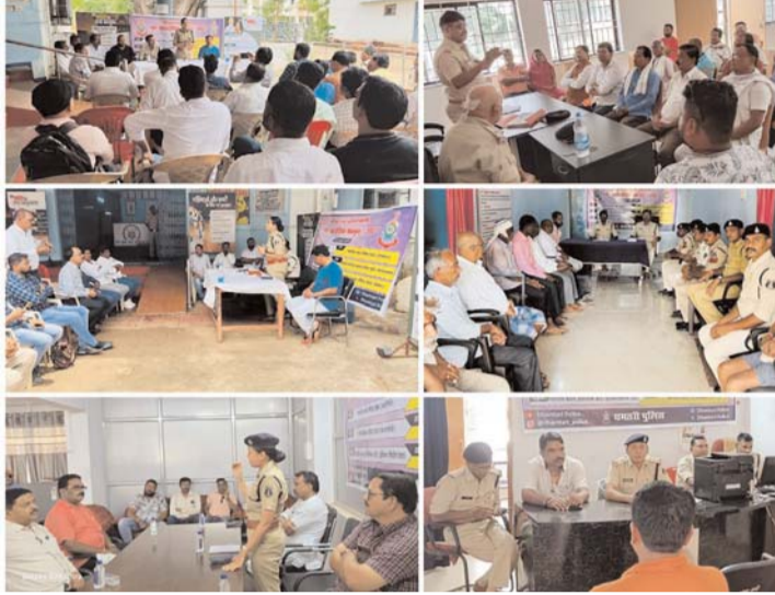
छिपाकर शादी करना या शादी का झूठा वादा कर यौन कृत्य करने को जघन्य अपराध की श्रेणी में रखा गया है। कार्यक्रम में उपस्थित जनसमूहों को बताया कि 1 जुलाई से लागू हो रही नई संहिताएं आधुनिक समय की आवश्यकताओं को ध्यान में रखकर तैयार की

1 जुलाई 2024 को सभी थाना चौकी में नये कानून उत्सव के रूप में आयोजित कर नए अपराधिक कानून के संबंध में जानकारी दी गई। तीन नए अपराधिक कानूनों में भारतीय न्याय संहिता (बीएनएस) 2023, भारतीय नागरिक सुरक्षा संहिता बीएनएसएस 2023 और भारतीय साक्ष्य अधिनियम बीएनएसएस 2023 को लेकर कलेक्टर नम्रता गांधी एवं पुलिस अधीक्षक अंजनेय वाण्य एवं अन्य पुलिस अधिकारियों की उपस्थिति में कार्यालय से प्राप्त निर्देशों के अनुक्रम में धमतरी पुलिस द्वारा जनजागरूकता बढ़ाने के उद्देश्य से जिला स्तरीय महत्वपूर्ण कार्यशाला आयोजन के लिए निर्देशित किया गया था। उपस्थित नागरिकगण, व्यापारीगण एवं जनसमूह को संबोधित करते हुये उन्हें नये महिला सुरक्षा कानून पर विस्तृत एवं बारीकी से जानकारी देते हुये कहा कि नये कानून में अब धारा 68, 69 के तहत पहचान