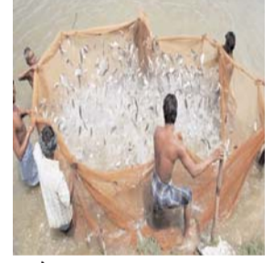
बलौदाबाजार। छत्तीसगढ़ राज्य मछली पालन विभाग के अधीनस्थ जिला बलौदाबाजार-भाटापारा में स्थित बलार सिंचाई जलाशय को मत्स्य पालन, मत्स्यखेट एवं मत्स्य विक्रय के लिए 10 वर्ष के पट्टे पर देने हेतु आवेदन आमंत्रित किया गया है। इच्छुक समिति या समूह अपना आवेदन 15 जुलाई 2024 तक कार्यालयीन दिवस एवं समय पर कार्यालय सहायक संचालक मछली पालन बलौदाबाजार में आवेदन दे सकते हैं। अधिक जानकारी के लिए उक्त कार्यालय से संपर्क किया जा सकता है।