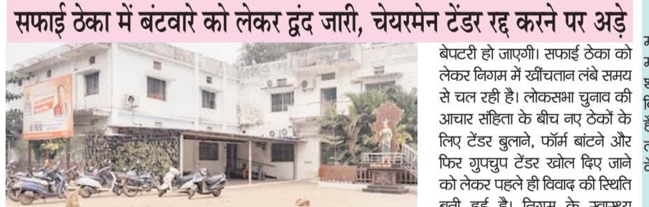
पायनियर संवाददाता < राजनंदगांव www.dailypioneer.com

सफाई ठेका में बंटवारे को लेकर द्वंद जारी, चेरयमेन टेंडर रद्द करने पर अड़े