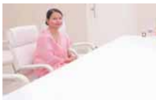
सीएम से मिल शिकायती एन सीपटी विधायक

संडीला (हरदोई)। क्षेत्रीय विधायक ने क्षेत्र में चल रहे अवैध भट्टों के संचालन और नगर पालिका परिषद द्वारा हिन्दू बहुल वॉर्डों में विकास कार्य न कराने का आरोप लगाते हुए मुख्यमंत्री से मिल लिखित शिकायत की है। क्षेत्रीय विधायक अलका अर्कवंशी ने मुख्यमंत्री योगी आदित्यनाथ से उनके कार्यालय में 22 जुलाई को भेंट करके उनसे लिखित रूप से शिकायत की कि विधानसभा क्षेत्र संडीला में लगभग 100 से अधिक ईंट भट्टे संचालित हैं। इन ईंट भट्टों के द्वारा पहले तो आसपास के इलाकों से अवैध रूप से मिट्टी का खनन किया गया जिससे उन क्षेत्रों में विशेष रूप से वर्षा के मौसम में भीषण