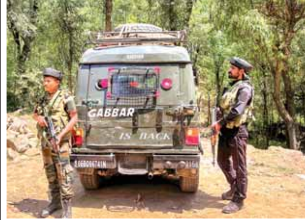
उत्तर कश्मीर के सोपोर स्थित त्रिमूर्ती इलाके में आतंकवादियों के साथ मुठभेड़ के दौरान सुरक्षा में तैनात जवान।