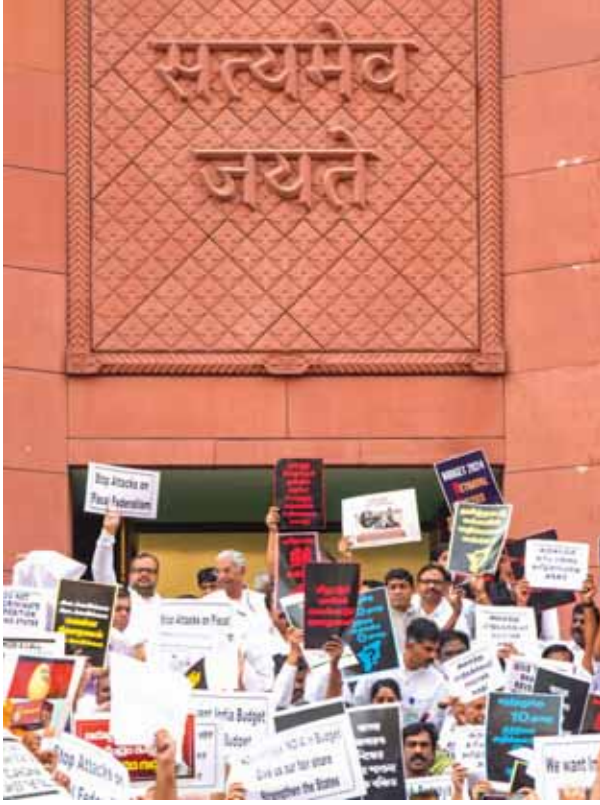
नई दिल्ली में सोनवार को बजट में कथित भेदभाव के विरोध में इंडिया गुट के सांसदों ने प्रदर्शन किया।

केंद्रीय बजट में विपक्ष शासित राज्यों के साथ कथित भेदभाव को लेकर विपक्षी दलों ने बुधवार को संसद के अंदर और बाहर जोरदार विरोध प्रदर्शन किया। इंडिया गुट से जुड़े सांसदों ने दिन के दौरान संसद परिसर में विरोध प्रदर्शन किया और राज्यसभा से भी वॉकआउट किया, जबकि अनुच्छेद 356 की तरह, आपातकाल लागू होने पर सत्तारूढ़ बेंच के बीच तीखी नोकझोंक देखी गई। वित्त मंत्री निर्मला सीतारमण ने विपक्षी दलों के आरोपों को 'अपमानजनक' बताया और कहा कि कांग्रेस द्वारा प्रस्तुत किए गए पिछले बजटों सहित सभी राज्यों का कर्मा भी उल्लेख नहीं किया गया। लोकसभा में विपक्ष के नेता राहुल गांधी ने कहा कि बजट 'भारत के संघीय ढांचे की पवित्रता पर हमला' है। सत्तारूढ़ भाजपा ने केंद्रीय बजट के विपक्षी शासित राज्यों के प्रति 'भेदभावपूर्ण' होने के आरोपों के आरोप को खारिज कर दिया और कहा कि मोदी सरकार ने हर राज्य और वर्ग का ख्याल रखा है।