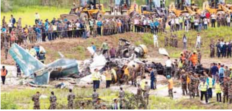
काठमांडू के त्रिभुवन इंटरनेशनल एयरपोर्ट पर विमान के दुर्घटनाग्रस्त होने के बाद राहत और बचाव कार्य।