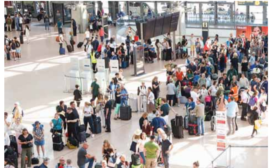
बेंगलुरु में माइक्रोसॉफ्ट के आउटेज के बीच केरलोगोड अंतरराष्ट्रीय हवाई अड्डे बेंगलुरु में यात्रियों की भीड़ लगी रही। बेंगलुरु हवाई अड्डे पर इंडिगो, एयर इंडिया एक्सप्रेस, स्पाइसजेट और अकासा ने शुक्रवार को मैनुअल रूप से यात्रियों की जांच शुरू की, हस्तालिखित बोर्डिंग पास जारी किए। वैश्विक माइक्रोसॉफ्ट आउटेज के कारण नैतिकद्वेष प्रचलन नियंत्रण प्रणाली टूट गई। पीटीआई

इस रूकावट के कारण एयर इंडिया, इंडिगो, अकासा एयरलाइंस और स्पाइसजेट सहित कई एयरलाइनों की बुकिंग और चेक-इन सेवाएं प्रभावित हुईं। यात्रियों को सलाह दी गई है कि वे पहले से ही हवाईअड्डे पहुंचें, क्योंकि मैनुअल चेक-इन में अधिक समय लगता है। उनसे यह भी आग्रह किया गया है कि इंतजार बढ़ने की स्थिति में वे सूखे खाद्य पदार्थ और पानी ले जाएं। यात्रियों को देरी के बारे में चेतावनी देने के लिए एयरलाइंस अपने सोशल मीडिया हैंडल पर अपडेट पोस्ट कर रही हैं। व्यवधान की इस अवधि के दौरान यात्रियों को हवाई अड्डे के कर्मचारियों के साथ सहयोग करने की सलाह देते हुए, नागरिक उड्डयन मंत्रालय (एमओसीए) ने कहा कि