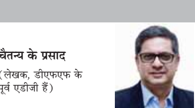
चैतन्य के प्रसाद