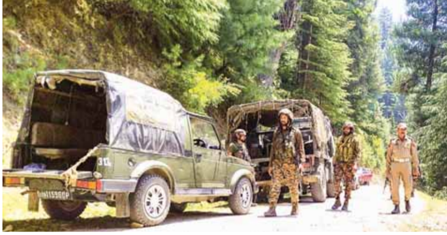
जम्मू-कश्मीर में डोडा जिले के डेसा जंगल में गंगलवार को आतंकवादियों से मुठभेड़ के दौरान सुरक्षाबलों के जवान।

उधमपुर के बसंतगढ़, अनंतनाग, किश्तवाड़ के केशवान और रामनग के पोगल परिसरान के साथ सीमा साझा करने वाले डेसा वन क्षेत्र में सोमवार देर रात संदिग्ध विदेशी आतंकवादियों के एक समूह के साथ भीषण गोलीबारी के दौरान तीन अन्य सैनिकों के साथ भारतीय सेना के एक कैप्टन शहीद हो गए। ऐसा संदेह है कि आतंकी जाल बिछाकर सुरक्षा बलों को संयुक्त टीम को धोखे से गहरे वन क्षेत्र में ले जाया गया, जहां विदेशी आतंकवादियों के एक मजबूत समूह ने उन पर घात लगाकर हमला किया। जैसा-ए-मोहम्मद के छद्म संगठन कश्मीर टाइगरर्स ने हमले की जिम्मेदारी ली है। यह भीषण हमला 8 जुलाई को कटुआ जिले की बिलावर तहसील के मछेड़ी के बदनोटा गांव के पास सैनिकों पर घात लगाकर किए गए एक और घातक हमले के ठीक बाद हुआ है, जिसमें पांच सैनिक शहीद हो गए थे और पांच अन्य घायल हो गए थे।