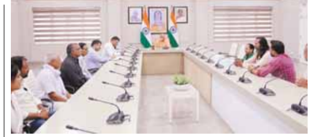
पंतनगर, इन्द्रप्रस्थनगर एवं रहीमनगर के लोगों की समस्या सुनते मुख्यमंत्री योगी आदित्यनाथ