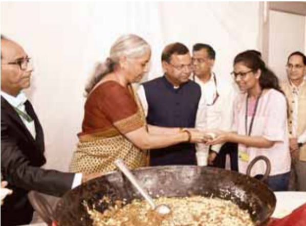
नई दिल्ली में मंगलवार को केंद्रीय वित्त मंत्री निर्मला सीतारमण ने हलवा समारोह के साथ बजट के अंतिम चरण की शुरुआत को चिह्नित किया।

केंद्र ने अगले सोमवार से शुरू होने वाले संसद के मानसून सत्र से पहले 21 जुलाई को एक सर्वदलीय बैठक बुलाई है, जिसके दौरान नरेंद्र मोदी के नेतृत्व वाली एनडीए सरकार के तीसरे कार्यकाल का पूर्ण वार्षिक बजट पेश किया जाएगा। केंद्रीय बजट 2024 के लिए बजट तैयारी प्रक्रिया के अंतिम चरण को चिह्नित करने वाला पारंपरिक 'हलवा समारोह' मंगलवार को नॉर्थ ब्लॉक में सीतारमण की उपस्थिति में आयोजित किया गया था। मंगलवार को आयोजित पारंपरिक हलवा समारोह, केंद्रीय बजट के संकलन के अंतिम चरण का भी प्रतीक है जिसकी शुरुआत वित्त मंत्री द्वारा कढ़ाई में हलवे को हिलाने और फिर कार्यालय में मंत्रालय के सहयोगियों को परोसने से होती है। हलवा समारोह हर साल बजट से पहले निभाई जाने वाली एक परंपरा है और यह आगामी वित्तीय वर्ष के लिए योजना तैयार करने के अंतिम चरण