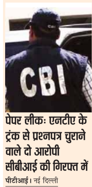
पेपर लीक: एनटीए के ट्रक से प्रश्नपत्र चुराने वाले दो आरोपी

मुख्यमंत्री योगी आदित्यनाथ ने बीते एक माह से अपने सपनों के घर को तोड़े जाने की भ्रामक खबरों से परेशान पंतनगर, इन्द्रप्रस्थनगर एवं रहीमनगर आदि क्षेत्रों के लोगों की समस्या का समाधान कर दिया है। मंगलवार को मुख्यमंत्री आवास पहुंचे प्रभावित परिवारों के भय और भ्रम फैला है, इसका कोई औचित्य नहीं था और इसके लिए जवाबदेही तय की जाए। मुख्यमंत्री ने उक्त क्षेत्र में साफ-सफाई व जनसुविधाओं के विकास के लिए भी आवश्यक निर्देश दिए हैं। उन्होंने अधिकारियों को निर्देशित किया है कि तत्काल क्षेत्र में विजित करें, लोगों से मिलें और उनका भय और भ्रम दूर किया जाए। प्रभावित परिवारों से वार्ता करते हुए मुख्यमंत्री ने कहा कि रिक्त बेंच विकसित करने में यदि कोई निजी भूमि पर बना भवन निर्माण आता है जिसका प्रमाणित स्वामित्व किसी निजी व्यक्ति का है, उसे नियमानुसार समुचित मुआवजा देकर (शेष पेज 9)