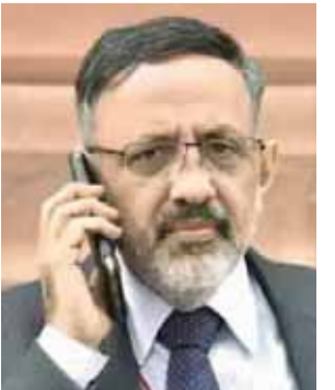
राजीव गौबा। फाइल फोटो

सरकार के सभी मंत्रालयों और विभागों के शीर्ष नोकरशाहों को सरकार के पहले 100 दिनों में शुरू की जाने वाली कम से कम एक प्रभावशाली परियोजना की पहचान करने और प्रधानमंत्री नरेंद्र मोदी की परिकल्पना के अनुसार कार्य बिंदुओं को लागू करने का निर्देश दिया गया है। सभी सचिवों को अपने स्वतंत्रता सचिव राजीव गौबा ने यह भी कहा कि मंत्रालयों और विभागों को अपनी नीतियों और योजनाओं को तैयार करने और लागू करने में संपूर्ण सरकार का दृष्टिकोण अपनाया होगा और भारत को तीसरा स्थान बनाने के लिए ठोस कदम उठाए जाने चाहिए। उन्होंने कहा कि