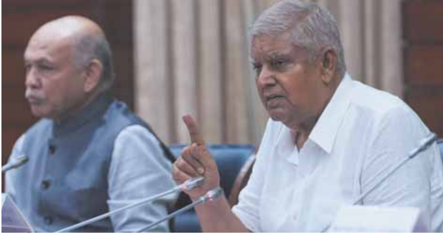
एक मिनट पहले आते हैं और तुरंत चले जाते हैं। राज्यसभा सभापति ने कहा कि सदस्यों को हिट-एंड-रन वाली रणनीति नहीं अपनानी चाहिए। धनखड़

राज्यसभा के सभापति जगदीप धनखड़ ने शनिवार को कहा कि राजनीतिक मुद्दा उठाने के लिए सदन की कार्यवाही के दौरान अमर्यादित व्यवहार लोकतंत्र की भावना पर आघात है। उन्होंने कहा कि आजकल सदस्य दूसरों के विचार सुनने को तैयार नहीं हैं। धनखड़ ने एक परिचय कार्यक्रम में नए राज्यसभा सदस्यों से कहा, आप दूसरों के विचारों से असहमत होने के लिए स्वतंत्र हैं। लेकिन दूसरे दृष्टिकोण को नजरअंदाज करना संसदीय परंपरा का हिस्सा नहीं है। उन्होंने कहा कि कुछ सदस्य अखबारों में जाह्र पाने की कोशिश करते हैं, सदन से निकलने के तुरंत बाद मीडिया में बयान देते हैं और अपनी ओर ध्यान खींचने के लिए सोशल मीडिया का इस्तेमाल करते हैं। उन्होंने कहा, सदस्य अपने भाषण से