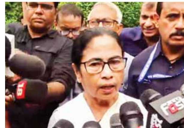
नई दिल्ली में शनिवार को नीति आयोग की बैठक से बाहर आने के बाद मीडिया से बात करती एडिशनल बिहार की मुख्यमंत्री ममता बनर्जी।

प्रधानमंत्री नरेंद्र मोदी की अध्यक्षता में शनिवार को हुई नीति आयोग की बैठक में राज्यों की प्रगति को बढ़ावा देने के बजाय राजनीतिक आतिशबाजी ज्यादा देखने को मिली। पश्चिम बंगाल को छोड़कर इंडिया ब्लॉक पार्टियों द्वारा शासित राज्यों द्वारा बैठक का बहिष्कार किया गया। जबकि पश्चिम बंगाल की मुख्यमंत्री ममता बनर्जी नीति आयोग की बैठक से बाहर चली गईं, एक और चर्चा जो चल रही थी वह बिहार के सीएम नीतीश कुमार की पूर्ण अनुपस्थिति थी, जिनकी पार्टी जेडीयू केंद्र में मोदी के नेतृत्व वाले एनडीए गठबंधन में दूसरी सबसे बड़ी पार्टी है। दिलचस्प बात यह है कि नीतीश ने पड़ोसी राज्य झारखंड में भाजपा के साथ गठबंधन में आगामी विधानसभा चुनावों के लिए जदयू की संभावनाओं पर चर्चा करने के लिए पटना में एक बैठक की।