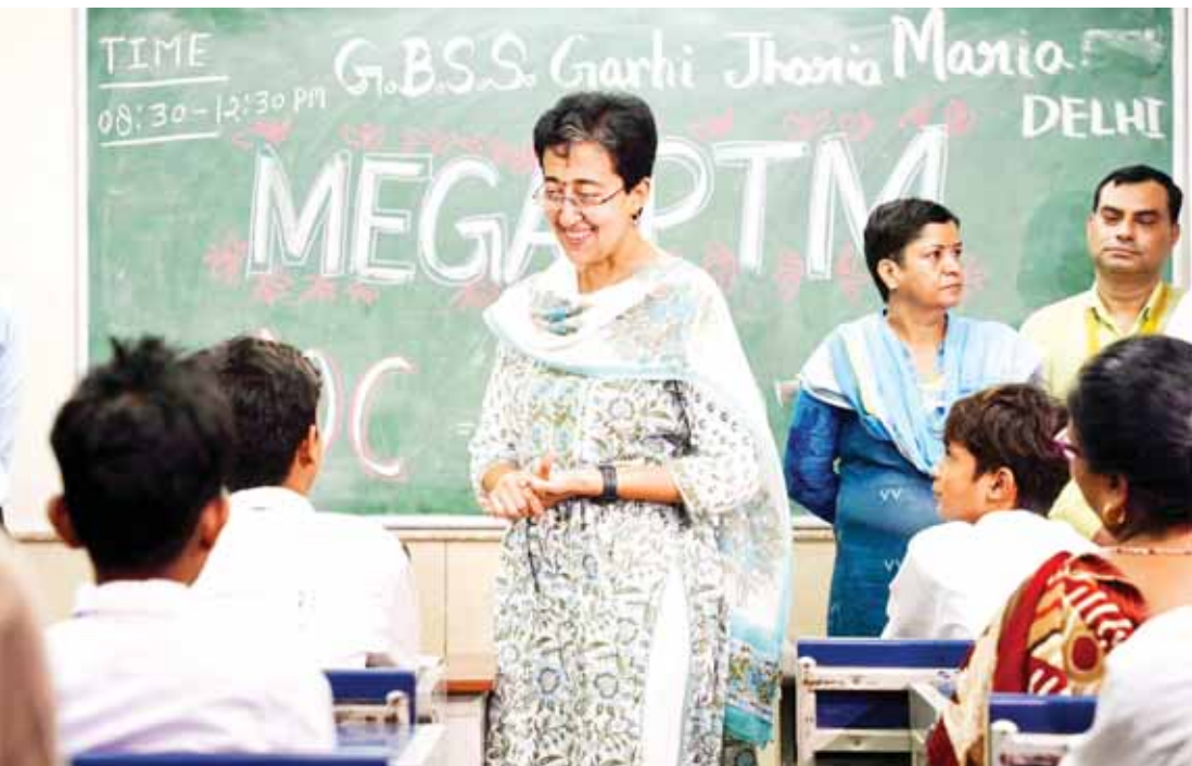
गवर्नमेंट ब्यांज सीनियर सेकेंड्री स्कूल, गढ़ी, कालकाजी में मेगा पीटीएम के दौरान बच्चों से बातचीत करती आतिथी।

हर तबके के बच्चों के लिए वर्ल्ड-क्लास एजुकेशन सुनिश्चित कर रहे हैं। हमारी सरकार की प्राथमिकता है कि हर बच्चे को शानदार शिक्षा मिलनी चाहिए क्योंकि बच्चे परिवार का भविष्य होने के साथ ही देश का भी भविष्य हैं। शिक्षा मंत्री ने कहा कि पीटीएम में पेरेंट्स की बढ़ती भागीदारी दर्शाता है कि टीचर्स के साथ साथ पेरेंट्स भी अपने बच्चों