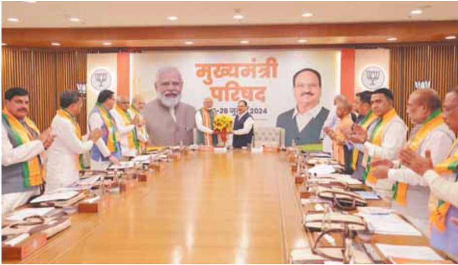
नीति आयोग की गवर्निंग काउंसिल की 9वीं बैठक में शामिल हुए मुख्यमंत्री

मुख्यमंत्री ने कहा कि सुदृढ़ कानून-व्यवस्था, ईज ऑफ डूइंग बिजनेस, निवेश अनुकूल नीतियों तथा सुरासन के परिणामस्वरूप उत्तर प्रदेश आज देश में निवेश के ड्रीम डेस्टिनेशन के तौर पर उभरा है। उन्होंने एमएसएमई, महिला सुरक्षा, इन्फ्रास्ट्रक्चर डेवलपमेंट, पीएम गति शक्ति, स्वास्थ्य एवं पोषण पर चरणवार यूपी की उपलब्धियां