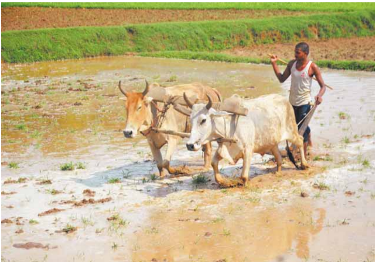
मिर्जापुर जिले के अमरावती गांव में मानसून के मौसम में धान की बुआई के लिए खेत तैयार करता किसान।