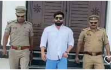
डीलर संग वीडियो बनवाते यूपी पुलिस के एसआई।

प्रॉपर्टी डीलर के हाल के 3 वीडियो वायरल हो रहे हैं। एक वीडियो निर्माणाधीन दिल्ली-देहरादून हाइवे पर लोनी क्षेत्र का है। इसमें बीच हाइवे पर