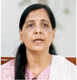
भाजपा प्रदेश अध्यक्ष ने बयान पर उठाए सवाल