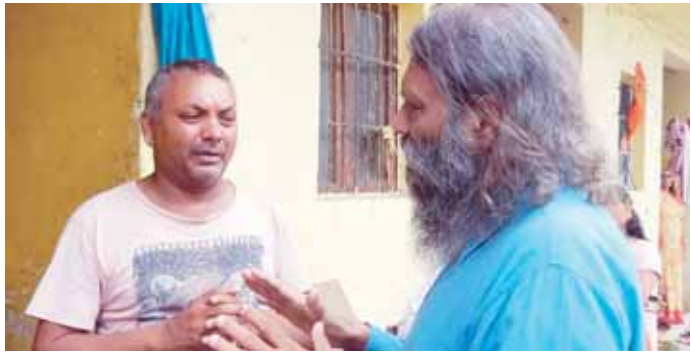
फैक्ट्री में हुए ब्लास्ट में पीड़ित परिवार से मुलाकात करते पूर्व डीजीपी शील मधुर।

दौलताबाद औद्योगिक क्षेत्र में बीते दिनों एक फैक्ट्री में हुए ब्लास्ट में 4 कर्मचारियों की दर्दनाक मौत हो गई थी। कुछ घायल भी हुए थे। पूर्व डीजीपी शील मधुर ने इस हादसे के पीड़ितों व परिवारों से घर जाकर मुलाकात की। उन्हें ढाढस बंधाते हुए कहा कि इस दुखद घटना में हम