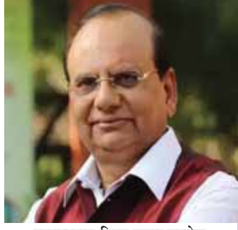
उपराज्यपाल विनय कुमार सक्सेना

एलजी सक्सेना ने शनिवार को मामले को विस्तृत जानकारी देते हुए, सतर्कता निदेशालय (डीओबी) के प्रस्ताव पर सहमत जताई कि भ्रष्टाचार निवारण (पीओसी) अधिनियम, 1998 की धारा 17 ए के तहत