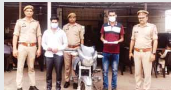
चोरी की बाइक के साथ थाना सेक्टर-113 पुलिस की गिरफ्त में दो लुटेरे।