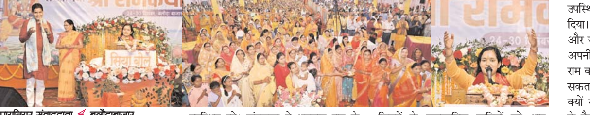
पायनियर संवाददाता < बलौदाबाजार www.dailypioneer.com