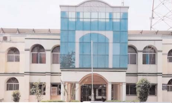
पायनियर संवाददाता < कवर्ध www.dailypioneer.com

कवरीधाम जिला का छत्तीसगढ़ में एक अलग ही पहचान है। प्रदेश और देश के नक्शा में कवर्धा का पहचान अपने कार्यों और यहां के मौजूद नेताओं से है। विभिन्न विभागों में पदस्थ अधिकारी कर्मचारी अपने अधीनस्थ सविदा /मानदेय पर कार्यरत लोगों से विभागीय कार्यों के अलावा अन्य कार्य भी करा रहे हैं। उक्त कार्यों को बेगारी में करने कर्मचारी मजबूर हो जाते हैं। कार्यों के लिए मना करने पर उन्हें सेवा समाप्ति का डर भय दिखाया जाता है।