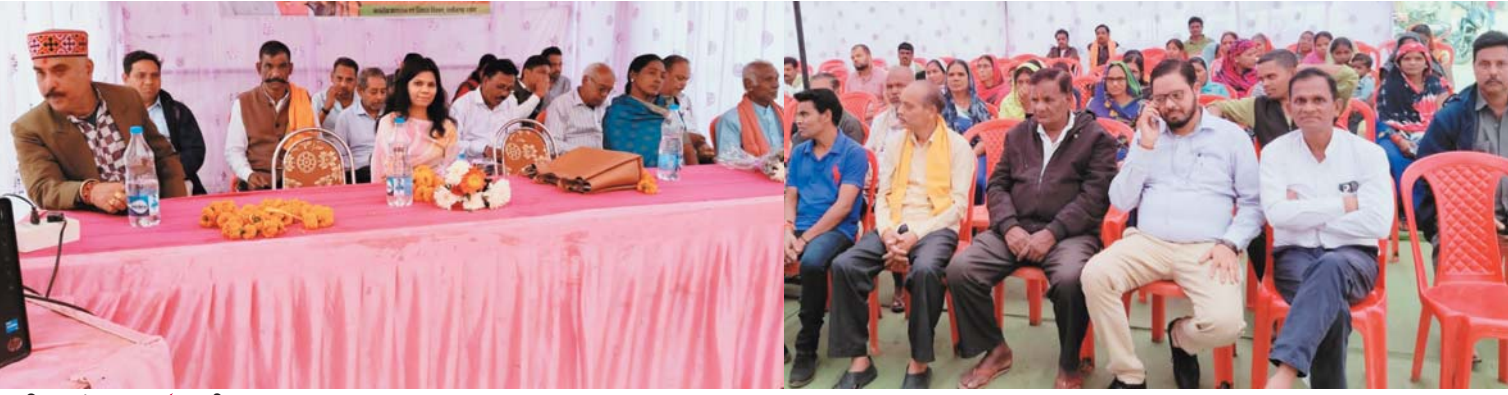
पायनियर संवाददाता < सक्ती www.dailypioneer.com

नवगठित शक्ति जिले के नगर पंचायत अड़भार में छत्तीसगढ़ शासन नगरीय प्रशासन विकास विभाग द्वारा अटल परिसर का निर्माण किया जाएगा, उपरोक्त निर्माण वचुंअल शिलान्यास 25 दिसंबर को भारत के पूर्व प्रधानमंत्री भारत रत्न स्व. अटल बिहारी वाजपेयी की जन्म जयंती पर छत्तीसगढ़ प्रदेश के मुख्यमंत्री विष्णु देव साय एवं राज्य के नगरीय प्रशासन विकास मंत्री अरुण साव ने राजधानी रायपुर से वचुंअल रूप से किया. इस अवसर पर नगर पंचायत