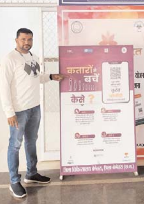
पायनियर संवाददाता < बेमेतरा www.dailypioneer.com

जिला अस्पताल बेमेतरा में अब मरीजों को ओपीडी पर्ची के लिए लाइन लगाने की जरूरत नहीं है। मरीज या परिजन घर बैठे ही मोबाइल ऐप (आभा) के माध्यम से अपना रजिस्ट्रेशन करा सकते हैं या फिर इसके लिए एस ऐप के क्यूआर कोड का भी इस्तेमाल कर सकते हैं।