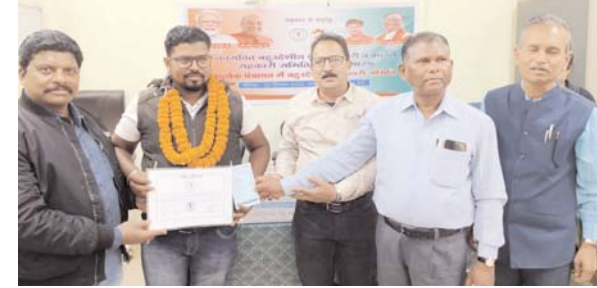
पायनियर संवाददाता < बेमेतरा www.dailypioneer.com

केन्द्र सरकार के सहकारी से समृद्धि योजनांतर्गत नवगठित बहुउद्देशीय पैक्स, डेयरी व मत्स्य सहकारी समितियों का शुभारम्भ वर्चुअल माध्यम से केन्द्रीय गृह एवं सहकारिता मंत्री अमित शाह के मुख्य आतिथ्य में किया गया। जिसके अंतर्गत जिला स्तर का कार्यक्रम जिला सहकारी केन्द्रीय बैंक शाखा बेमेतरा से अधिकारी-कर्मचारी वर्चुअल उपस्थित हुए। अमित शाह ने अपने उद्बोधन में कहीं कि देश के प्रत्येक पंचायत में कोई न कोई सहकारी समिति कार्यरत होगी। इसके अंतर्गत देश भर में 2 लाख नये सहकारी समिति का गठन किया जायेगा। देश में प्रत्येक सहकारी समितियों का कम्प्यूटरीकरण किया जा रहा है। ये समिति बहुउद्देशीय रूप से कार्य करेगी। इन समितियों को सीएससी केन्द्र के रूप में विकसित किया गया है। सहकारी समिति के सदस्यों एवं कर्मचारियों को पूर्ण रूप से प्रशिक्षित किया जायेगा। समितियों में माइक्रो एटीएम स्थापित किये जा रहे हैं। इस बहुउद्देशीय कार्य से किसानों एवं समितियों की आर्थिक परिस्थिति में सुधार होगा। देश में सहकारी समितियों के गठन से उसके सामाजिक स्तर को सुधारने में मदद मिलेगी। इसके अंतर्गत