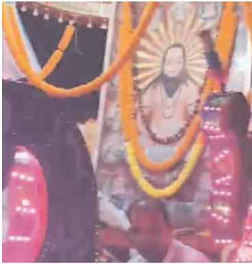
शुभकामनाएं देते हुए कार्यक्रम की समाप्ति मंदिर प्रांगण पर किया गया।