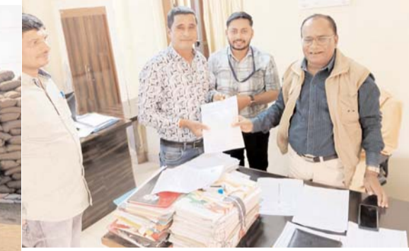
पायनियर संवाददाता < बेमेतरा www.dailypioneer.com

अल्टीमेटम दिया है। जिला सहकारी समिति कर्मचारी संघ द्वारा केंद्रों में पड़े बफर लिमिट के ऊपर दुगुना तिगुना हुए धान की वजह से बन रही जाम की स्थिति को देखते हुए धान का उठाव व परिवहन और धान खरीदी वर्ष 2023-24 का कमीशन प्रदान करने कलेक्टर, खाद्य