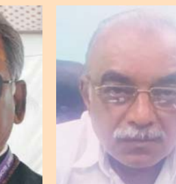
गुरुभुज मुर्तेजा गुरुनानक टेंट हाउस बेमेतरा