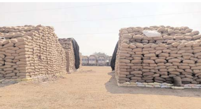
पायनियर संवाददाता < बालोद www.dailypioneer.com

धान खरीदी का उठाव तेज गति से नहीं किए जाने से नाराज समिति प्रबंधकों ने प्रशासन को 17 दिसंबर तक धान का पूर्णतः उठाव करने की मांग की है, अन्यथा 18 से सभी केंद्रों में धान खरीदी बंद करने का