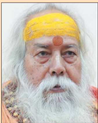
जगतगुरु स्वामी स्वरूपानंद सरस्वती जी