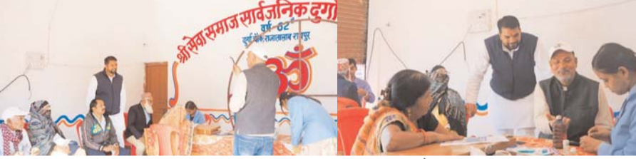
पायनियर संवाददाता < रायपुर www.dailypioneer.com

राजधानी रायपुर के पंडित रविशंकर शुक्ल वार्ड में