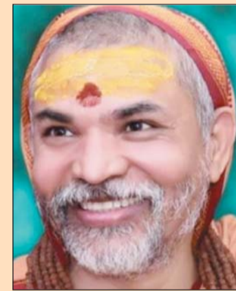
जगद्गुरु शंकराचार्य स्वामी श्री अविमुक्तेश्वरानंद सरस्वती जी