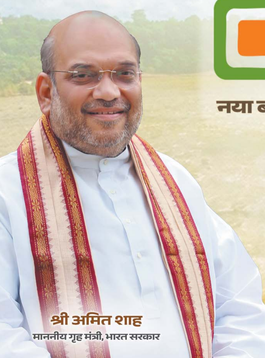
श्री अमित शाह माननीय गृह मंत्री, भारत सरकार

हैं। उनकी प्रगति को व्यक्तिगत पदों से नहीं, बल्कि व्यापक सामाजिक लाभ से मापा जाता है। उन्होंने कहा कि भारत की लोकतांत्रिक यात्रा इस बात का उदाहरण है कि विविधता और विशाल जनसांख्यिकीय क्षमता राष्ट्रीय प्रगति को बढ़ावा दे सकती है।