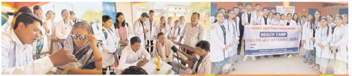
पायनियर संवाददाता < रायपुर www.dailypioneer.com

श्री बालाजी इस्टीट्यूट ऑफ मेडीकल साइंस, मोवा रायपुर के मेडीकल कॉलेज के छात्रों व हॉस्पिटल के सहयोग से 11 दिसंबर को ग्राम चटौद में सामान्य स्वास्थ्य जांच शिविर का आयोजन किया गया। श्री बालाजी मेडीकल कॉलेज के सामुदायिक चिकित्सा विभाग द्वारा यह शिविर का आयोजन किया गया था, जिसमें लाभार्थियों को