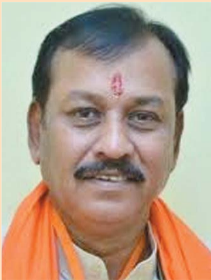
विजय बधेल सांसद दुर्गा

दिनांक 7 दिसंबर शनिवार से पूर्णिमा रविवार 15 दिसंबर तक श्री मद्भागवत कथा कथा समय दोपहर 1 बजे से हरि इच्छा तक स्थान कृषि उपज मंडी परिसर बेमेतरा 7 दिसंबर को भव्य कलश यात्रा, 15 दिसंबर को पूर्णाहुति प्रतिदिन प्रातः 8 बजे से हवन पूजन