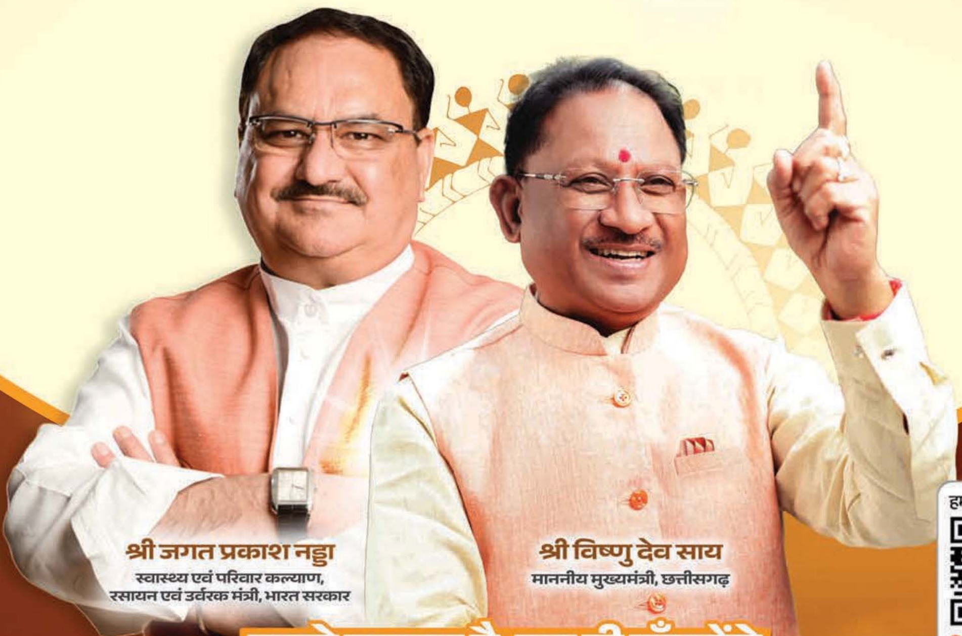
श्री जगत प्रकाश नड्डा स्वास्थ्य एवं परिवार कल्याण, रसायन एवं उर्वरक मंत्री, भारत सरकार