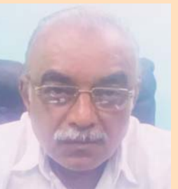
गुरुभैज मुर्तेजा गुरुनानक टेंट हाउस बेमेतरा