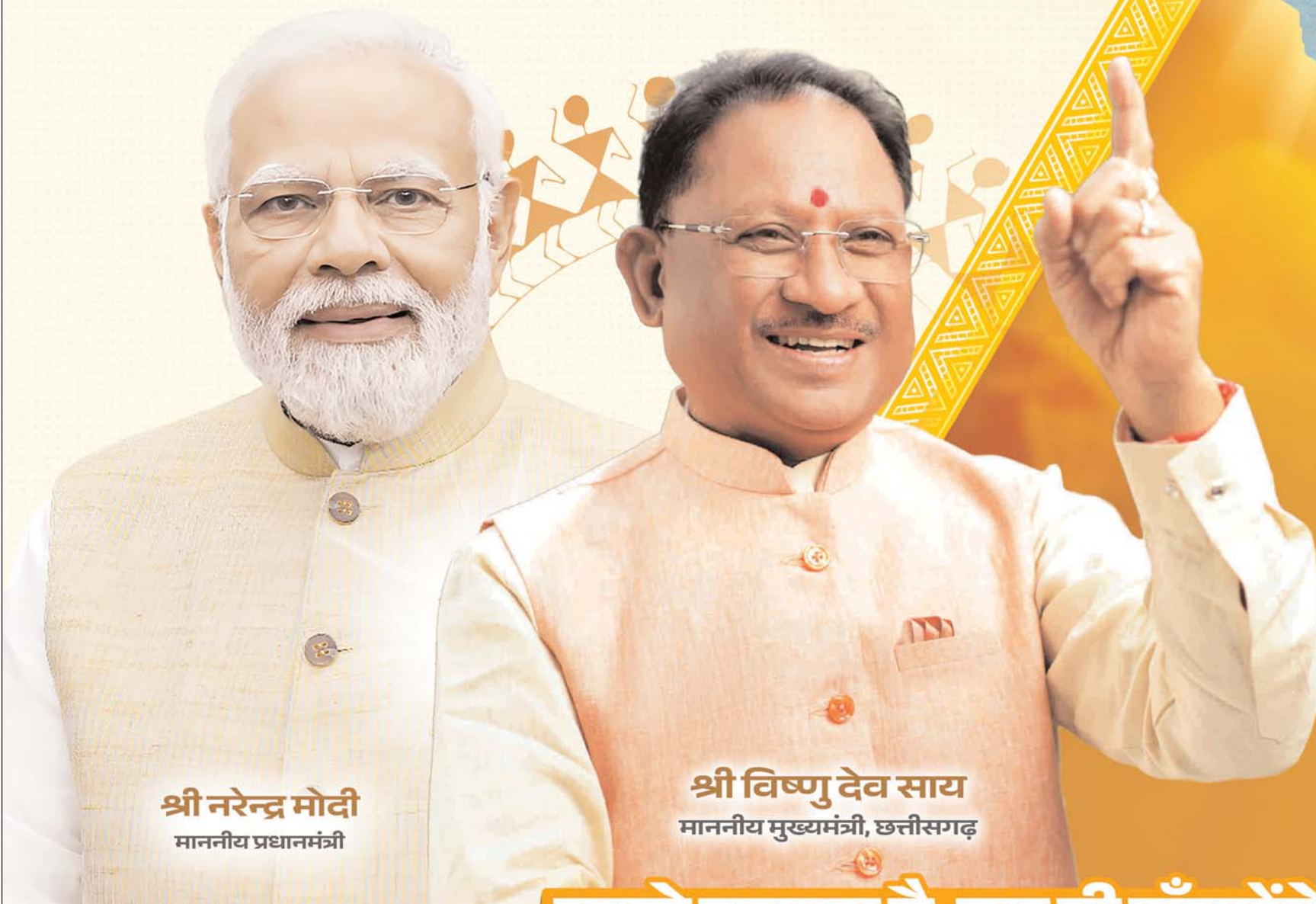
श्री नरेन्द्र मोदी माननीय प्रधानमंत्री