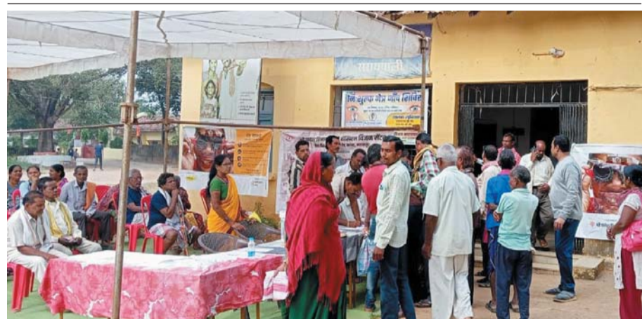
सरायपाली। नगर के पुराना सरकारी अस्पताल में विशाल नेत्र शिविर का आयोजन किया गया। जिसमें बड़ी संख्या में लोग जांच व परामर्श लिया गया। भीड़ की संख्या को देखते हुए आने वाले समय में पुनः शिविर आयोजित किया जाएगा।

करते हुए न्यायालय में अभियोग पत्र प्रस्तुत किया गया था। जिस पर सुनवाई के दौरान दोष सिद्ध पाए जाने पर न्यायाधीश कोष्टा के द्वारा गांजा परिवहन करने वाले आरोपी को 14 वर्ष के सश्रम कारावास एवं एक लाख रुपए के अर्थ दंड से दंडित किया गया है। अभियोजन का संचालन देवेंद्र कुमार शर्मा विशेष लोक अभियोगक एनडीपीएस के द्वारा किया गया था।