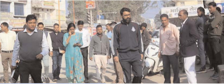
साफ-सफाई, सौंदर्यीकरण कार्य, लाइटिंग व्यवस्था, स्वीकृत विकास कार्य को गुणवत्तापूर्वक करने के लिए निर्देश

पायनियर संवाददाता < जशपुरनगर www.dailypioneer.com