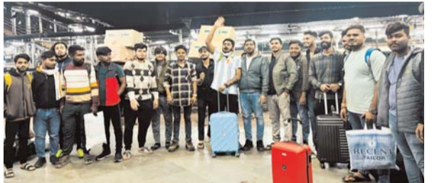
पायनियर संवाददाता धमतरी www.dailypioneer.com