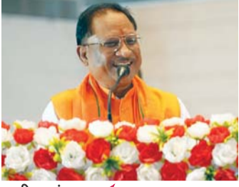
पायनियर संवाददाता < जशपुरनगर www.dailypioneer.com

मुख्यमंत्री के निर्देश पर स्ट्रीट लाईट स्थापना, खेल उपकरण व अन्य विकास कार्यों के लिए 1.35 करोड़ रूपए की राशि स्वीकृत