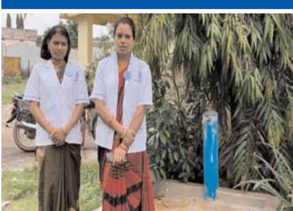
पायनियर संवाददाता < दुर्ग www.dailypioneer.com

दुर्ग जिले के ग्राम चिरपोटी में जल जीवन मिशन के तहत हर घर तक नल से जल पहुंचाने की पहल ने ग्रामीणों के जीवन में बड़ा बदलाव ला दिया है। पहले पानी की भारी कमी से जूझ रहे इस गांव में महिलाओं को कई कठिनाइयों का सामना करना पड़ता था। लेकिन अब हर घर को स्वच्छ और नियमित पेयजल मिल रहा है। इस योजना ने न केवल पानी की समस्या का समाधान किया, बल्कि गांव की महिलाओं के जीवन को भी पूरी तरह बदल दिया। प्रधानमंत्री नरेंद्र मोदी द्वारा 2019 में जल जीवन मिशन की शुरुआत