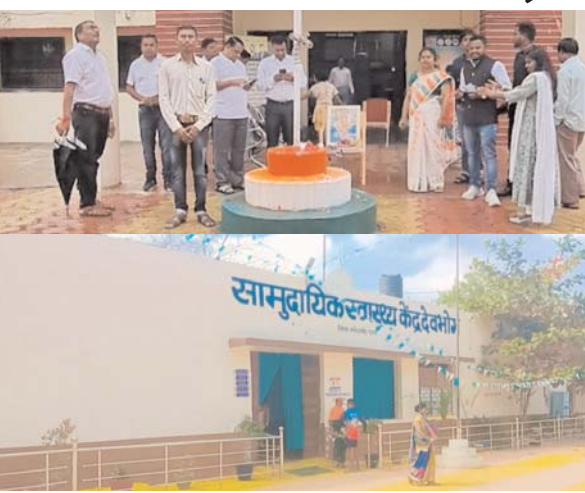
पायनियर संवाददाता < गरियाबंद www.dailypioneer.com

जिला स्वास्थ्य विभाग द्वारा कमी अनुसार सेटअप नहीं बिताने के चलते गरियाबंद जिला नर्स डॉक्टर विशेषज्ञ पुरुष और महिला एचआरओ फार्मासिस्ट सहित अन्य कर्मचारियों के कमी की किल्लत से जूझते प्राथमिक स्वास्थ्य केंद्र उपस्वास्थ्य केंद्र सहित अस्पताल मजबूरीखाना खानापूर्ति तरीके से