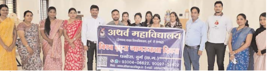
पायनियर संवाददाता < उतई www.dailypioneer.com

अथर्व महाविद्यालय धनोरा में विश्व एड्स दिवस मनाया गया। कार्यक्रम का अंतर्गत महाविद्यालय के छात्र छात्राओं एवं प्राध्यापकों द्वारा एड्स जागरूकता रैली निकालकर