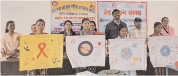
पायनियर संवाददाता < नारायणपुर www.dailypioneer.com

स्वास्थ्य जीवन शैली के साथ आयुर्वेद योग को अपनाने