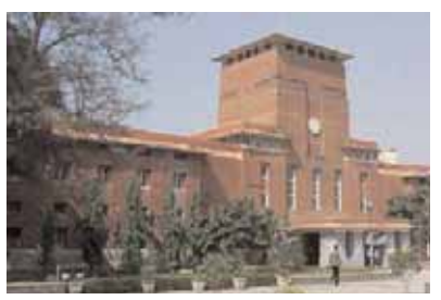
पायनियर समाचार सेवा। नई दिल्ली

● अकादमिक परिषद ने दी मंजूरी नया कोटा विश्वविद्यालय द्वारा पेश किए जाने वाले सभी 77 स्नातकोत्तर कार्यक्रमों पर लागू होगा