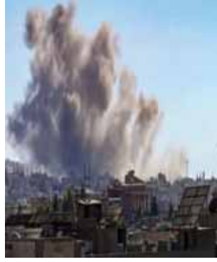
हवाई हमलों के बाद तालिबान के कब्जे में आने वाले क्षेत्रों में आग लग गई है।