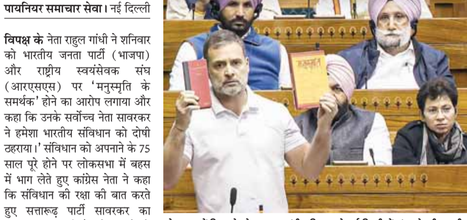
लोकसभा में विपक्ष के नेता राहुल गांधी शनिवार को नई दिल्ली में संसद के शीतकालीन सत्र के दौरान सदन में विचार व्यक्त करते हुए।

रहते हुए कई फैसलों का हवाला देते हुए कहा कि इस परिवार ने 'खून का स्वाद चखा' और बार-बार संविधान को चोट पहुंचाई। उन्होंने सदन में विपक्ष के नेता राहुल गांधी और उनकी सांसद बहन प्रियंका गांधी वाड्डी पर कटाक्ष करते हुए कहा, 'उनकी अगली पीढ़ी भी इसी खेल में लगी हुई है।' प्रधानमंत्री ने कहा कि उनके जैसे नेता और कई अन्य जो साधारण परिवारों से आते हैं, वे कभी भी उस मुकाम तक नहीं पहुंच पाते, जहां वे पहुंचे हैं, लेकिन कांग्रेस की ताकत के बिना। संविधान के मूल्यों के प्रति अपनी दीर्घकालिक प्रतिबद्धता को रेखांकित करते हुए उन्होंने कहा कि गुजरात के मुख्यमंत्री के रूप में, प्रधानमंत्री मोदी ने कहा कि उनकी सरकार ने संविधान को अपनाने के 60वें वर्ष का जश्न हाथी पर दस्तावेज की एक प्रति रखकर मनाया, जबकि वे इसके सर्वोच्चता को उजागर करने के लिए एक प्रतीकात्मक इशारे में नंगे पैर उसके नीचे चले। नेहरू-गांधी परिवार की आलोचना करते हुए उन्होंने कहा कि भारत के पहले प्रधानमंत्री जवाहरलाल नेहरू ने 'अभिव्यक्ति की स्वतंत्रता पर अंकुश लगाने के लिए देश के मार्गदर्शक दस्तावेज में संशोधन किया और उनकी बेटी इंदिरा गांधी ने एक सांसद के रूप में अपने चुनाव को रद्द करने वाले सुप्रीम कोर्ट के फैसले की अवहेलना करने के लिए आपातकाल लगाया।' (शेष पृष्ठ 9)