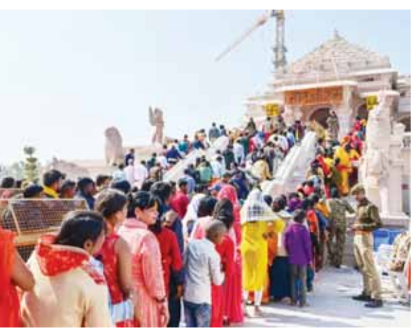
हालांकि, घरेलू यात्री अब अयोध्या और वाराणसी जैसे आध्यात्मिक और सांस्कृतिक रूप से महत्वपूर्ण स्थलों को पसंद करते हैं। लोग सार्धक यात्रा अनुभवों की तलाश कर रहे हैं जो उन्हें उनकी विरासत से जोड़ते हैं।' पर्यटन