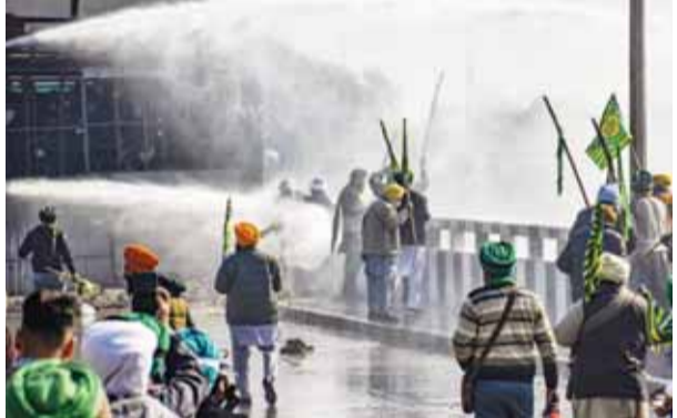
शंभू बॉर्डर पर आंदोलन कर रहे किसानों को तितर-बितर करने के लिए सुरक्षाकर्मीयों ने आंसू गैस और पानी की बौछारों का इस्तेमाल किया।