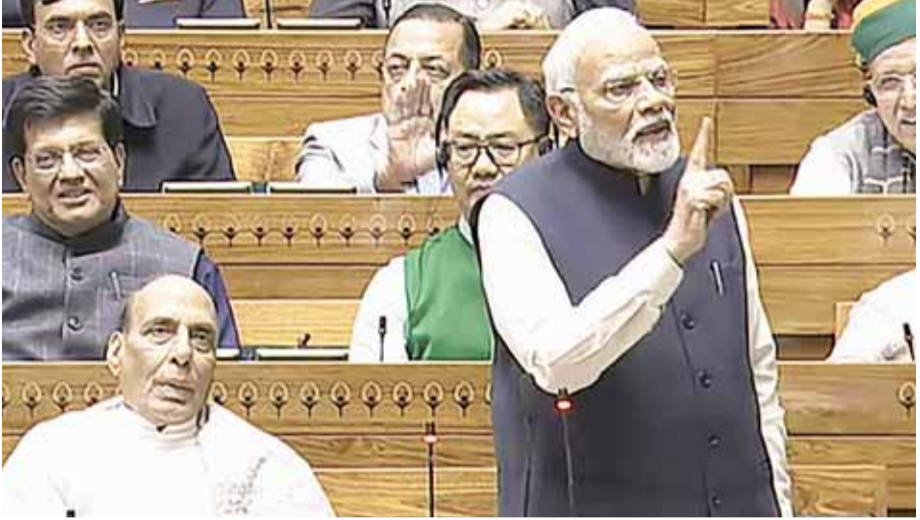
प्राधानमंत्री नरेंद्र मोदी संसद में 'भारतीय संविधान के 75 वर्षों की गौरवशाली यात्रा' पर चर्चा के दौरान लोकसभा में बोलते हुए