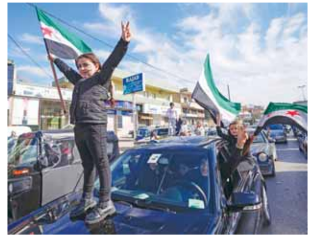
सीरिया की सीमा के पास लेबनान के बाहर एलियास शहर में बशर असद की सरकार के पतन का जश्न मनाते सीरिया के लोग।

वहीं सीरिया के प्रधानमंत्री मोहम्मद गाजी जलाली ने एक वीडियो बयान जारी करके कहा कि वह शासन की वागडोर शांतिपूर्ण तरीके से विपक्ष को सौंपने के लिए तैयार है। जलाली ने कहा, मैं अपना आवास पर ही हूँ। मैं कहीं नहीं गया हूँ क्योंकि मुझे अपने देश से प्रेम है। उन्होंने कहा कि वह सुबह काम करने के लिए अपने कार्यालय जाएंगे। उन्होंने सीरियाई नागरिकों से सार्वजनिक संपत्ति को नुकसान न पहुंचाने का आग्रह किया। प्रधानमंत्री ने कहा कि कल रात से यह