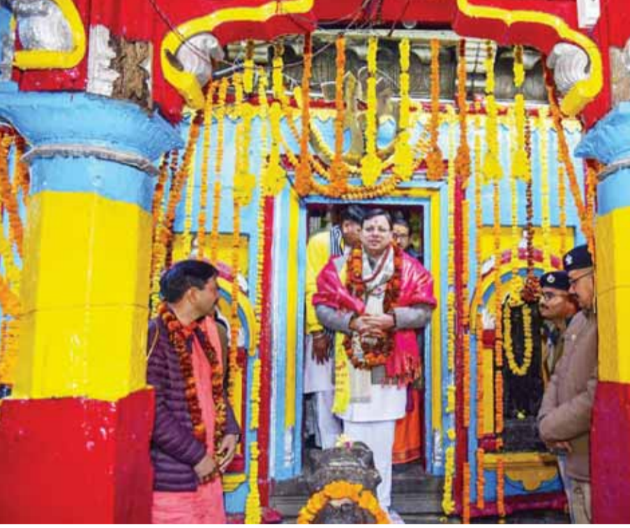
रुद्रप्रयाग के अोंकारेश्वर मंदिर में पूजा-अर्चना कर वापस आते उत्तराखंड के मुख्यमंत्री पुष्कर सिंह धामी

देहरादून। (भाषा) उत्तराखंड के मुख्यमंत्री पुष्कर सिंह धामी ने रविवार को रुद्रप्रयाग जिले में स्थित बाबा केदार के शीतकालीन प्रवास स्थल उखीमठ के अोंकारेश्वर मंदिर में पूजा-अर्चना कर चारधाम शीतकालीन यात्रा की शुरुआत की। इस मौके पर मुख्यमंत्री ने प्रशासन द्वारा यात्रा के लिए की गई विभिन्न व्यवस्थाओं का स्थलीय निरीक्षण किया तथा अधिकारियों को श्रद्धालुओं की यात्रा को सुगम बनाने के लिए सभी आवश्यक व्यवस्थाएं सुनिश्चित करने के निर्देश दिए। उन्होंने कहा कि उन्होंने बाबा केदार का आशीर्वाद लेते हुए आधिकारिक रूप से चारधाम शीतकालीन यात्रा की शुरुआत की है और उनकी सरकार का प्रयास है कि वर्ष में 12 महीने श्रद्धालु और पर्यटक राज्य में आएँ जिससे प्रदेशवासियों का रोजगार भी चलता रहे। उन्होंने कहा कि शीतकालीन यात्रा शुरू करने से प्रदेश में तीर्थयात्र व पर्यटन और सशक्त होगा। धामी ने कहा, इससे न केवल वर्षभर पर्यटकों का आगमन होगा, बल्कि यहां के अनेक पर्यटन स्थलों को भी नई पहचान मिलेगी। साथ ही स्थानीय निवासियों के लिए रोजगार के नए अवसर सृजित होंगे जो उनकी आर्थिक स्थिति को सुदृढ़ बनाने में सहायक होंगे।