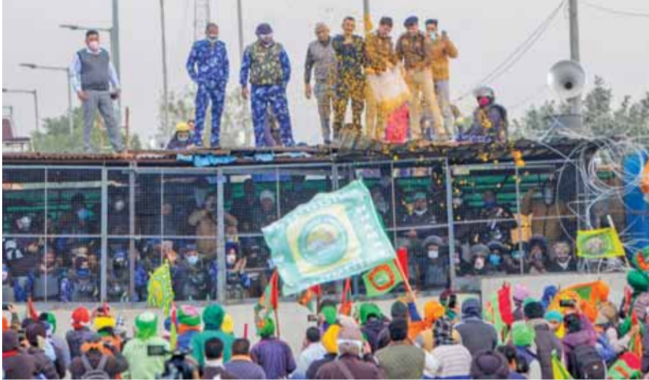
परियाला के शंभू बाईर पर आंदोलन कर रहे किसानों पर फूल बरसाते पुलिस ठरनी।

किसानों ने रविवार को शंभू बाईर से पैदल मार्च शुरू किया, लेकिन हरियाणा पुलिस ने पंजाब से हरियाणा में प्रवेश के लिए लगाए गए बहुसंख्यक बैरिकेडिंग पर ही उन्हें रोक दिया। प्रदर्शनकारी किसान जत्थे और सुरक्षाकर्मियों के बीच तीखी झड़प हुई। हरियाणा पुलिस ने किसानों से पैदल मार्च निकालने के लिए जरूरी अनुमति दिखाने को कहा। पुलिस ने दावा किया कि उनके पास किसान संगठनों ने 101 किसानों के नामों की सूची दी है, लेकिन प्रदर्शनकारी किसानों के नाम सूची के अनुसार नहीं थे। मौके पर तकराव बढ़ने के साथ किसानों को तितर-बितर करने के लिए आंसू गैस के गोले दागे गए और पानी की बौछरों की गई, जिससे कई प्रदर्शनकारी घायल हो गए। आंसू गैस के गोलों ने किसानों को कुछ मीटर पीछे हटने पर मजबूर कर दिया, जिनमें से कुछ ने अपने चेहरे ढके हुए थे और सुरक्षात्मक चश्मा पहने हुए