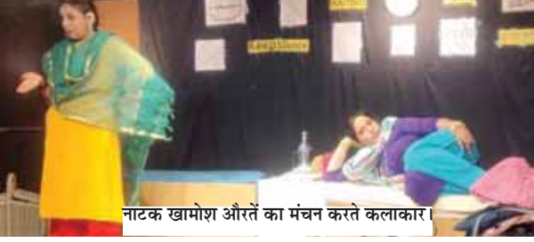
नाटक खामोश औरतें का मंचन करते कलाकार।