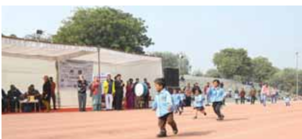
पैरा एथलेटिक्स प्रतियोगिता में भाग लेते बच्चे।