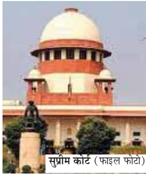
सुप्रीम कोर्ट (फाइल फोटो)