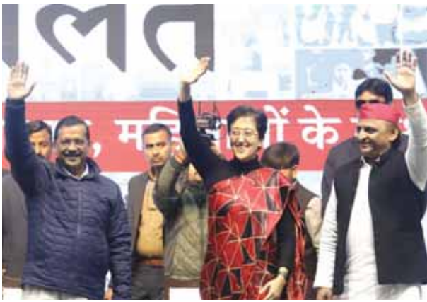
राजधानी में आयोजित महिला सम्मान कार्यक्रम में आप प्रमुख अरविंद केजरीवाल, सीएम आतिशी के साथ समाजवादी पार्टी के नेता अखिलेश यादव।

केजरीवाल ने कहा, दिल्ली की महिलाएं मेरे लिए वोट बैंक नहीं हैं, वह उन्हें अपनी बहन और मां मानते हैं। उनकी सुरक्षा सुनिश्चित करने के लिए अपनी पूरी ताकत लगा दी। आप के सत्ता में आने से पहले राष्ट्रीय राजधानी में सीसीटीवी कैमरे नहीं थे। लोगों की सुरक्षा बढ़ाने के लिए सीसीटीवी कैमरे लगाए और दिल्ली परिवहन निगम की बसों में बस मार्शल नियुक्त किए। यह कार्यक्रम वर्ष 2012 में दिल्ली में हुई सामूहिक बलात्कार की घटना की 12वीं बरसी पर आयोजित किया गया था। कार्यक्रम में आप प्रमुख ने निर्भया को श्रद्धांजलि दी। इस अवसर पर बड़ी संख्या में महिलाओं ने निर्भया अमर रहे और महिला शक्ति जिंदाबाद जैसे नारे लगाए। इस अवसर पर टीवी एक लोकप्रिय कार्यक्रम आप की अदालत की तर्ज पर महिलाओं के खिलाफ अपराधों को उजागर करने वाला एक छोटा वीडियो दिखाया गया, जिसमें केंद्रीय गृह मंत्री अमित शाह पर