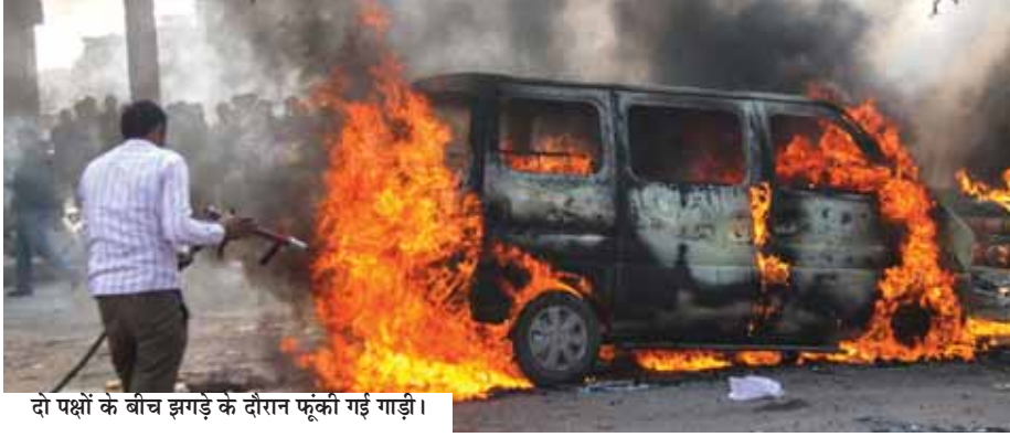
दो पक्षों के बीच झगड़े के दौरान फूंकी गई गाड़ी।

सोहना चौक स्थित ओल्ड जेल कॉम्प्लेक्स में दो पक्षों के बीच हुए रविवार की रात को विवाद के बाद भयंकर लड़ाई हो गई। किसी तरह से झगड़े को शांत किया गया। सोमवार की सुबह 11 बजे फिर से उनके बीच झगड़ा हुआ और वहां खड़ी गाड़ियों को तोड़ा। एक गाड़ी को आग के हवाले कर दिया गया। किसी भी पक्ष ने पुलिस में शिकायत नहीं दी। इस घटना की सूचना पाकर पुलिस मौके पर पहुंची। पुलिस प्रवक्ता ने सोमवार को बताया कि पूरे घटनाक्रम की बारीकी से जांच की जा रही है। जानकारी के अनुसार ओल्ड जेल