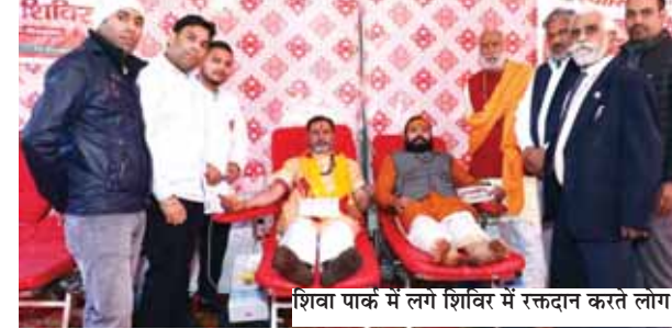
शिवा पार्क में लग शिविर में रक्तदान करते लोग।

स्वास्तिक फाउंडेशन की ओर से पूर्व प्रधानमंत्री स्व. अटल बिहारी वाजपेयी की याद में रक्त दान शिविर लगाया गया। सेक्टर-5 स्थित शिवा पार्क में इस शिविर का उद्घाटन विधायक मुकेश शर्मा ने किया। अनेक समाजसेवी लोगों ने भी इस आयोजन में शिरकत करके आयोजकों को बधाई दी। इस दौरान पूर्व प्रधानमंत्री और स्वास्तिक फाउंडेशन के पूर्व चेयरमैन स्व. लखन अरोड़ा को श्रद्धांजलि भी दी गई।