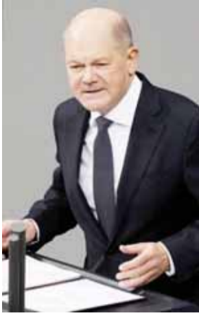
स्थिर अर्थव्यवस्था को पुनर्जीवित करने के तरीके को लेकर उद्पन्न विवाद में अपने वित्त मंत्री को निष्कासित कर दिया था, जिसके

कारण गत छह नवम्बर को तीन-पक्षीय गठबंधन ध्वस्त हो गया था। कई प्रमुख दलों के नेताओं ने समय से सात माह पहले 23 फरवरी को आम चुनाव कराने को लेकर सहमति जताई। विश्वास मत की आवश्यकता इसलिए थी, क्योंकि द्वितीय विश्व युद्ध के बाद जर्मनी का संविधान बुडेस्टेग को भंग करने की अनुमति नहीं देता। अब राष्ट्रपति फ्रैंक-वॉल्टर स्टीनमीयर को यह तय करना है कि संसद को भंग किया जाए या नहीं और चुनाव कराए जाएं या नहीं। उनके पास यह निर्णय लेने के लिए 21 दिन हैं और चुनाव की योजनाबद्ध समय-सीमा के कारण क्रिसमस के बाद इसकी उम्मीद है। संसद भंग होने के बाद, चुनाव 60 दिनों के भीतर होने चाहिए।