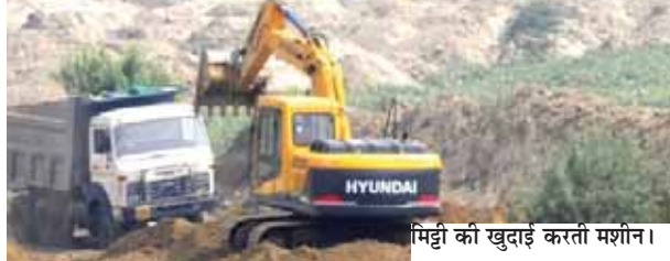
मिट्टी को खुदाई करती मशीन।

नोएडा में जेवर कोतवाली क्षेत्र के गोविंदगढ़ गांव के पास एक व्यक्ति के खेत से खनन माफियाओं ने करीब 4 बीघा जमीन से 5 फीट गहरा गड्ढा करके मिट्टी का अवैध खनन कर लिया। जिससे पीड़ित की फसल भी बर्बाद हो गई। मामले की जानकारी होने पर जब पीड़ित में विरोध किया तो आरोपियों ने पीड़ित को जान से मारने की नीयत से उस पर कई राउंड फायरिंग कर दी। मामला तब तक घटना में पीड़ित बाल बाल बच गया। पीड़ित ने इस मामले में 18 नामजद समेत 28 आरोपियों के खिलाफ जेवर कोतवाली में विभिन्न धाराओं में सोमवार को केस दर्ज कराया है।