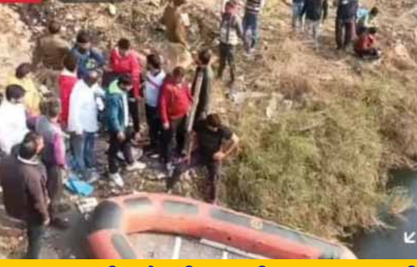
रात भर चली खोजबीन, अभी तक सुराग नहीं

बुढ़ेना के समीप सेल्समैन का काम करने वाले एक युवक ने आगरा नहर में छलांग लगा दी। जिसका अभी तक कोई सुराग नहीं लग सका है। एनडीआरएफ की टीम तलाश में जुटी है। युवक मिर्जापुर का रहने वाला है। बताया जाता है कि युवक नहर किनारे बाइक खड़ी करके नहर में कूद गया। एक युवक ने उसे बचाने की कोशिश की, लेकिन कामयाब नहीं हो सका। घटना रविवार रात करीब पौने दस बजे की है। दमकल विभाग और एनडीआरएफ की टीमों नहर में युवक की तलाश में जुटी हैं। अभी तक नहर में कूदने के कारणों का पता नहीं लगा है। परिजन काफी परेशान हैं। सूचना मिलने पर पहुंची पुलिस जांच में जुटी है। पुलिस और दमकलकर्मी उसकी तलाश करते रहे लेकिन कोई सुराग नहीं लगा। सोमवार को गाँजियाबाद से एनडीआरएफ की टीम भी मौके पर पहुंची और घटनास्थल से करीब दो तीन किमी. एरिया की खाक छानी लेकिन युवक का कुछ