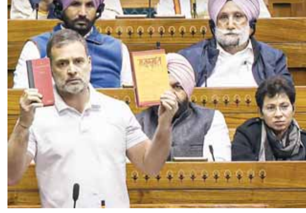
लोकसभा में विपक्ष के नेता राहुल गांधी शनिवार को नई दिल्ली में संसद के शीतकालीन सत्र के दौरान सदन में विचार व्यक्त करते हुए।

गांधी ने कहा कि वह हर गरीब व्यक्ति को बताना चाहते हैं कि संविधान उनकी रक्षा करता है, लेकिन भाजपा चौबीसों घंटे इस पर हमला करती रहती है। उन्होंने पिछले सत्र में सदन में किए गए अपने वादों को भी दोहराया कि जाति जनगणना कराई जाएगी और आरक्षण पर 50 प्रतिशत की सीमा को समाप्त किया जाएगा ताकि देश में 'नए प्रकार का विकास' हो सके। मैं अपने भाषण की शुरुआत आपके सर्वोच्च नेता सावरकर और भारत के संविधान पर उनके विचारों