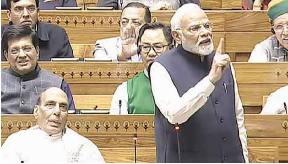
प्रधानमंत्री नरेंद्र मोदी संसद में 'भारतीय संविधान के 75 वर्षों की गौरवशाली यात्रा' पर चर्चा के दौरान लोकसभा में बोलते हुए