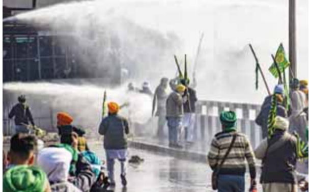
शंभू बॉर्डर पर आंदोलन कर रहे किसानों को तितर-बितर करने के लिए सुरक्षाकर्मीयों ने आंसू गैस और पानी की बौछारों का इस्तेमाल किया।

यह झड़प उस समय हुई जब 101 किसानों का एक समूह, जो दोपहर के समय पंजाब-हरियाणा सीमा पर शंभू विरोध स्थल से अपना मार्च फिर से शुरू कर रहा था, हरियाणा पुलिस द्वारा लगाए गए बैरिकेड्स पर पहुंच गया। आंसू गैस