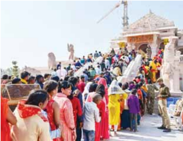
हालांकि, घरेलू यात्री अब अयोध्या और वाराणसी जैसे आध्यात्मिक और सांस्कृतिक रूप से महत्वपूर्ण स्थलों

'अयोध्या के पर्यटन में वृद्धि अभूतपूर्व है। हमने पिछले साल की तुलना में अयोध्या पर्यटन के लिए बुकिंग में 70 फीसदी की वृद्धि देखी है। देश भर के भक्त और सांस्कृतिक उत्साही इस ऐतिहासिक परिवर्तन का हिस्सा बनना चाहते हैं।' ताजमहल एक वैश्विक प्रतीक बना हुआ है, लेकिन इसके पर्यटकों की संख्या में घरेलू आगंतुकों की संख्या में मामूली गिरावट देखी गई है, हालांकि अंतरराष्ट्रीय आगमन विभाग में गिरती है या गिरने की संभावना होती है। आयोग विभिन्न वायु प्रदूषण श्रेणियों यानी चरण एक से चार के तहत प्रचलित क्यूआई और मौसम पूर्वानुमान के अनुसार ग्रैप की अनुसूची में किसी भी अपवाद और अतिरिक्त उपायों पर निर्णय ले सकता है। सलाह