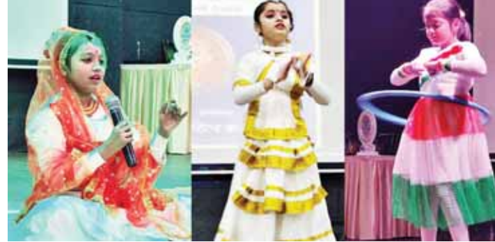
सुरुचि परिवार की ओर से 28वें कला उत्सव में प्रस्तुति देते बच्चे।