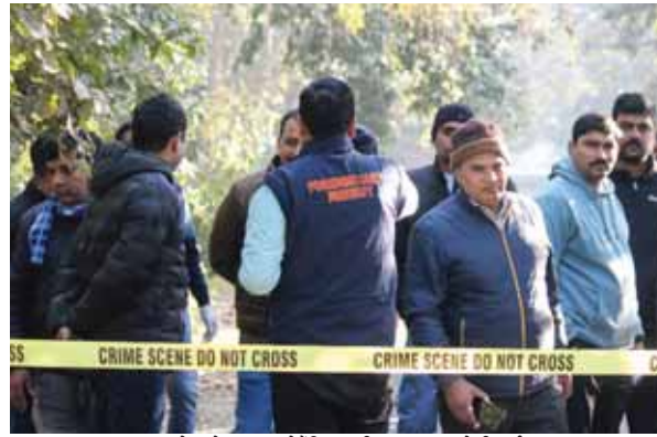
मुठभेड़ के बाद फोरेंसिक टीम जायजा लेती हुई।