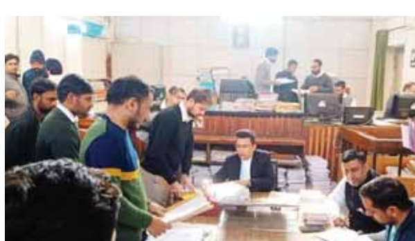
राष्ट्रीय लोक अदालत में मामलों के निपटार के लिए पहुंचे लोग।

जिला विधिक सेवाएं प्राधिकरण की ओर से शनिवार को राष्ट्रीय लोक अदालत का आयोजन किया गया। इस राष्ट्रीय लोक अदालत के लिए कुल 22 पीठों का गठन किया गया। इसके साथ उप मंडल सोहना एवं पटौदी में भी लोक अदालत का आयोजन किया गया। उप मंडल सोहना में एक बेंच और पटौदी में एक बेंच लगाई गईं। मुख्य न्यायिक दंडाधिकारी एवं सचिव जिला विधिक सेवाएं प्राधिकरण रमेश चंद्र ने बताया कि शनिवार को आयोजित लोक अदालत में उपमंडल सहित सभी श्रेणी के करीब 60,520 मामलों पर संज्ञान लिया गया। इसमें से 55,635 मामलों का मौके पर ही निपटारा कर दिया गया। सभी पीठ में एक-एक पैरल अधिवक्ता को नियुक्त किया गया।