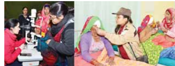
याद-ए-मुश्दि परम पिता शाह सतनाम जी महाराज फ्री आई कैंप में नेत्र जांच करते चिकित्सक व ऑपरेशन किए हुए बुजुर्गों की सेवा करतीं सेवादात्री।

पूजनीय परम पिता शाह सतनाम जी महाराज की पावन स्मृति में आयोजित 33वें याद-ए-मुश्दि परम पिता शाह सतनाम जी महाराज फ्री आई कैंप में तीसरे दिन भी जारी रहा। कैंप में