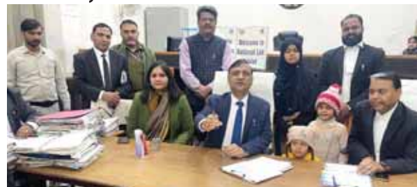
फरीदाबाद में लोगों लोक अदालत में सुनवाई के दौरान न्यायाधीश व फरीदादी।