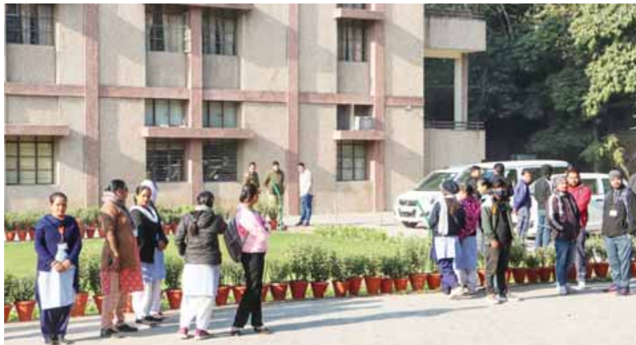
श्रीनिवासपुरी स्थित कैम्ब्रिज स्कूल के बाहर अपने बच्चों को लेने पहुंच अभिभावक। साथ में पुलिसकर्मी जायजा लेते हुए।

राजधानी दिल्ली में एक बार फिर दहशत फैलाने की कोशिश हुई है। शुक्रवार तड़के करीब 30 स्कूलों में बम की धमकी मिली, जिसके बाद वहां अफरा-तफरी बच गई और अभिभावक अपने बच्चों को स्कूल से लेने के लिए तुरंत वहां पहुंचे। दिल्ली पुलिस का बम निरोधक दस्ता, डॉग स्कवाड स्कूलों का कोना-कोना खंगाला लेकिन कुछ ही संदिग्ध नहीं मिला। इसके बाद पुलिस और स्कूल प्रशासन ने राहत की सांस ली। पुलिस ने बम की सूचना को अफवाह करार दिया। दिल्ली पुलिस की विशेष शाखा ने अपराधिक धमकी और साजिश का मामला दर्ज कर लिया है, लेकिन अभी तक आरोपियों के बारे में कोई सुराग नहीं मिल पाया है।