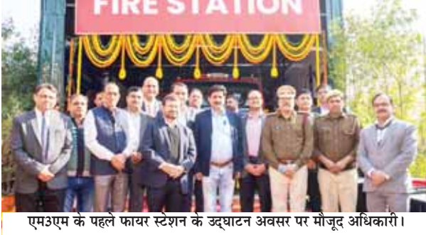
एम3एम के पहले फायर स्टेशन के उद्घाटन अवसर पर मौजूद अधिकारी।

उद्घाटन समारोह के मुख्य अतिथि हरियाणा अग्निशमन सेवा के उप-निदेशक गुलशन कालरा थे। गुलशन कालरा ने क्षेत्र में सुरक्षा और आपातकालीन तैयारियों को बढ़ाने में एम3एम की इस पहल को एक उल्लेखनीय योगदान बताया। कालरा ने यह भी घोषणा की कि इस